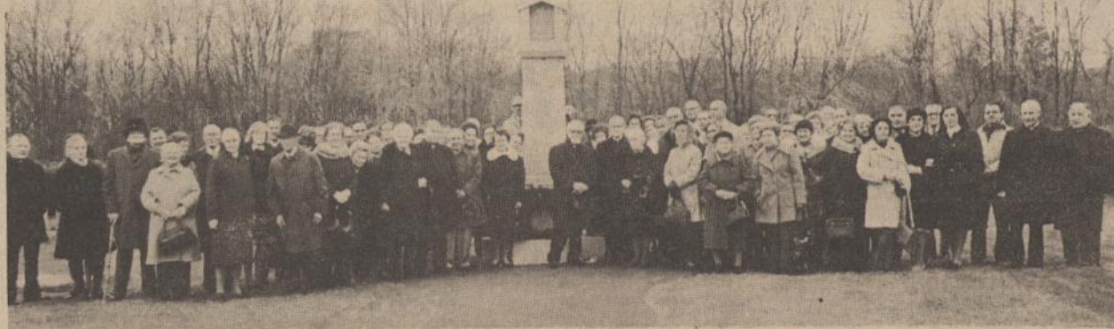
Putnamo seselių rėmėjų sąskrydžio dalyviai lapkričio 7 susirinkę Dangaus Vartų kapinėse bendrai maldai už mirusius.

Matulaitį padarė kun. St. Yla. 1977 sausio 27 sueina 50 metų nuo palaimintojo mirties. Šią sukaktį reikėtų paminėti visose lietuvių kolonijose ir prašyti popiežių, kad greičiau paskelbtų jį šventuoju.