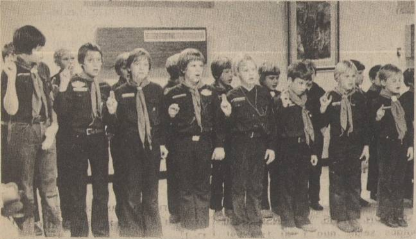
Gausi vilkiukų draugovė išsiriškiavusi iškilmingai sukaktuvinių metų užbaigimo sueigai.

Kaip būtų gražu, kad žmonės vienas kitam būtų broliai, kaip mokė Kalėdų Kūdikis. Koks pasaulis būtų šviesus, jei vietoj baimės būtų galima užkalbinti praėvį ir palinkėti jam linksmy