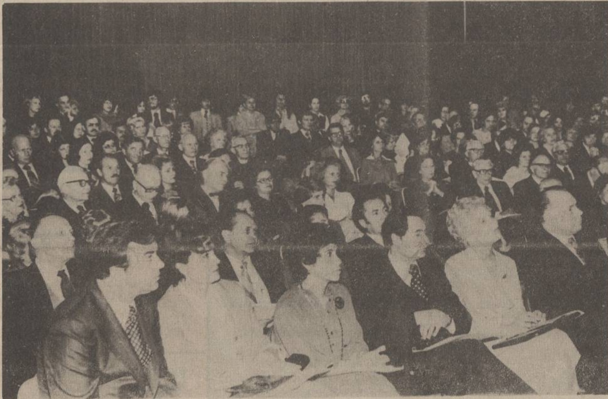
Lietuvių Bendruomenės tarybos nariai ir svečiai klausosi dr. Z. Brzezinski pranešimo prieš vizitą Baltuosiuose Rūmuose.

Po oficialių kalbų minėjimo dalyviai buvo pakviesti į prezidentūros valgomąjį įpratinėm vaišėm.