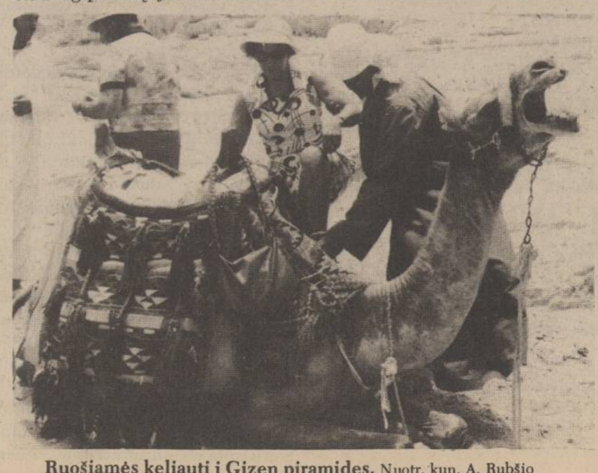
Ruošiamės keliauti į Gizen piramides.