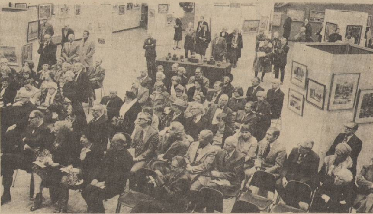
Dešimtos dailės parodos atidaryme Kultūros Židinyje.

Kas turėtų konkursu rūpintis? Galėtų PLB Švietimo Taryba, bet jos rankos jau ir taip pilnos; galėtų Eglutės redakcinis personalas — jei gražiai paprašytume. O gal kokia moterų organizacija, kuriai rūpi lietuviybės