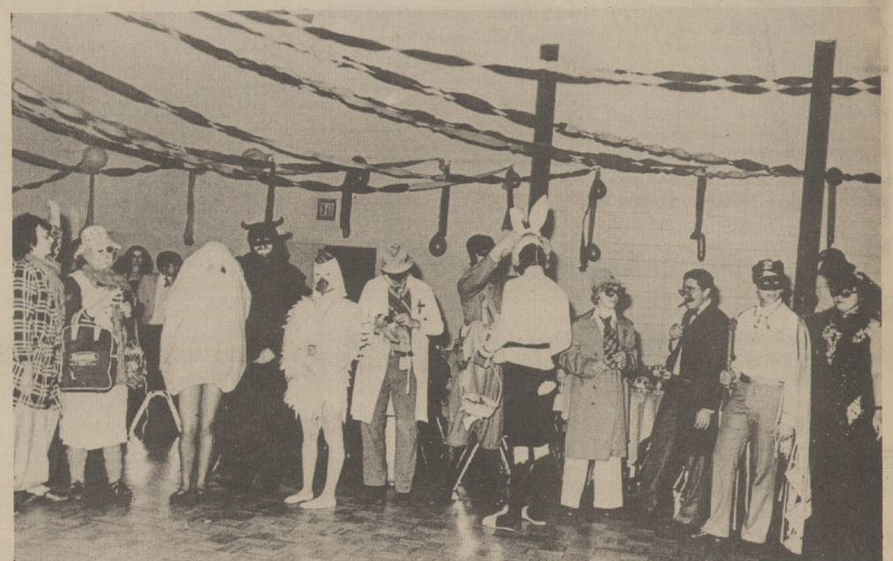
Dalis kaukių balius dalyvių.