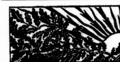
ATMINČIAI KUN. VIENAŽINDZIO