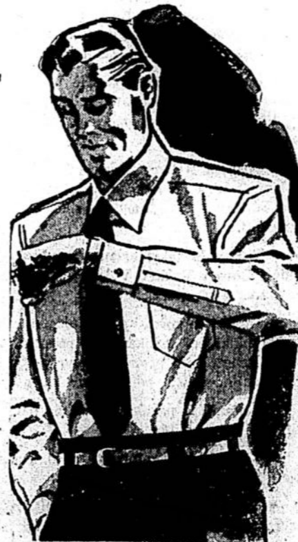
The May Co.'s Basement Men's Furnishings Department

Šie nėra paprasto išpardavimo marškiniai, bet valstybiniai reklamuoti parduodami visoj Amerikoje už 2.95 ir 3.95! Mes negalime paminti šio garsaus gaminimo pavadinimo, bet jūs pažinsit šiuos tikrai vertingus marškinius. Žinomi dėl jų patogaus tinkamo, atsargaus pagaminimo, puikios išvaizdos ir vertingos medžiagos. Reguliarios rankovės, French rankovės, paprasti balti, įvairūs raštai, marras ir kiek balto plono aureklo ir 8 apykaklės rūšys pritaikyti kiekvieno skoniui! Dydžiai 13½-32 rankovių. Dyžiniai 14 iki 14½—32 iki 34 rankovių. Dydžiai 15 iki 16½—32 iki 35 rankovių ir 17 iki 17½—33 iki 35 rankovių ilgių.