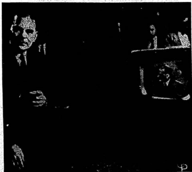
Nyū Jorko gubernatorius Thomas E. Dewey pranešė, kad jis pasitraukia į privatinį gyvenimą ir politinėms pareigoms nebekandiduos. Dewey asmeny lietuvių visad jautė savo reikalų užtėrėją. Reikia tikėti, kad Dewey dar kartą grįš. Kas pradeda politinį darbą — taip greit iš jo nepasitraukia.

Vienu metu atrodė, kad ši šalininkų pakišta idėja susilauks daugumos pritarimo, nes ir pats ministras pirmininkas nebuvo priešingai naujai konferencijai.