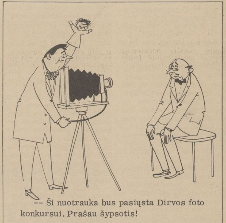
-- Ši nuotrauka bus pasiųsta Dirvos foto konkursui. Prašau šypsotis!

* Valst. sekr. Herteris spaudos konferencijoje pareiškė, kad Chruščiovo pasiūlyme visiems ir visiškai nusiginkluoti, yra neatsakyta į svarbiausią klausimą: jeigu visos tautos panaikins savo kariuomenes, kaip taika galės būti išlaikyta, jei vis dėlto atsiras užsispyrėlių kariauti, nors ir peiliais".