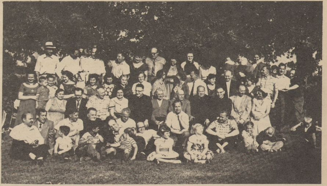
Iš Argentinos atvykusių lietuvių grupė per savo jaučio kepimo pramogą - asado prie Chicagos esančioje Marijonų seminarijos sodyboje.

Dėl skaitytojų laiškų sumažėjimo mūsų muzikos kritikas taip pasiaiškina: Esą lengva aprašyti