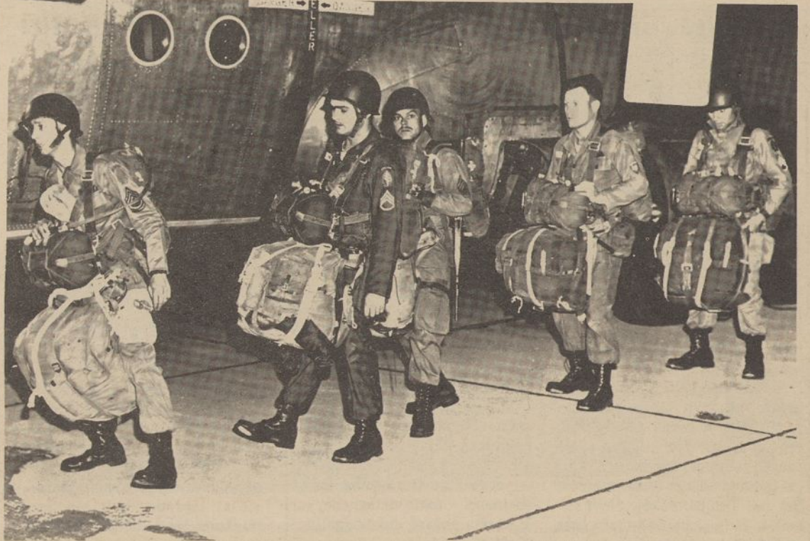
Dešimtosios Specialių Pajėgų Grupės kariai, su pilna kovos apranga, pasiruošę dar vienam pratimui iš lėktuvo. Kariai, kurie su parašiuotais nusileido virš 100 kartų, šioje grupėje nėra ypatingas reiškinys.

Keturi ginklų specialistai yra nuodugnai susipažinę su kiekvienu amerikiniu ginklu, pradedant pistoletu ir baigiant 105 mm šautuvu. Jie susipažinę ir su kitataučių įvairiausiais ginklais.