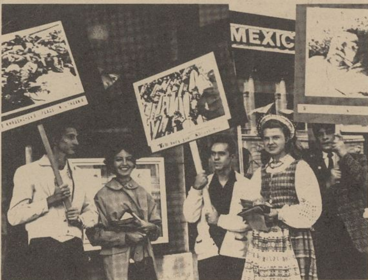
Chicago lietuviai studentai demonstruoja prieš Chruščiovo atvykimą į JA Valstybes, įvykusiose Chicago vidurmiestyje. Čia buvo nešiojamos didelės nuotraukos, vaizduojančios komunistų vykdytus žudymus Lietuvoje ir dalinami prieškomunistiniai lapeliai.

* Jungt. Tautų plenumas atmetė Indijos pasiūlymą įtraukti komunistinės Kinijos atstovavimo klausimą į darbotvarkę. Ki-