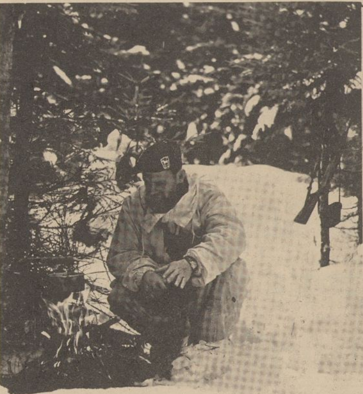
Dešimtosios Specialių Pajėgų Grupės karys Bavarijos Alpėse šildosi prie ugnelės.

Svarbiausias jo tikslas, kad kiekvienas vyras pajėgtų apginti savo gyvybę tuščiom rankom, išliktų gyvas nepereinamose pelkėse ir sniego plotuose, sugebėtų išsimaitinti gyvatėmis, uogomis ar vabzdžiais, užrištom akim pajėgtų išardyti ir sustatyti amerikinius ir sovietinius ginklus. Kiekvienas jo grupės vyras išmoksta, kaip laikytis be laisvių stovyklose ir kaip iš jų pabėgti, kaip atsilaikyti tardymuose ir kankinimuose.