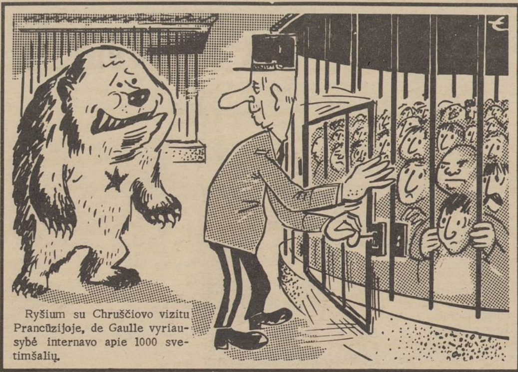
Ryšium su Chruščiovo vizitu Prancūzijoje, de Gaulle vyriausybė internavo apie 1000 sveitimšalių.