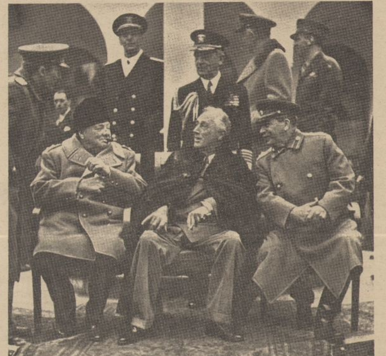
Jaltos konferencijoje, 1945 vasario pradžioje, buvo milijonai Rytų Europos gyventojų išduoti sovietinei vergijai. Vienu svarbiausių sergančio prez. Rooseveltto patarėjų toje konferencijoje buvo Alger Hiss, kuris išdavinėjo Stalinui JAV paslaptis ir prez. Rooseveltą nuteikino pritari Stalinui.

Tuo metu, kai amerikiniai specialistai ir aukščiausieji JAV štabų šefai buvo apgyvendinti už buvusios carų rezidencijos Livadijos sienų, Alger Hissas gavo kambarį šalia prezidento Roose-