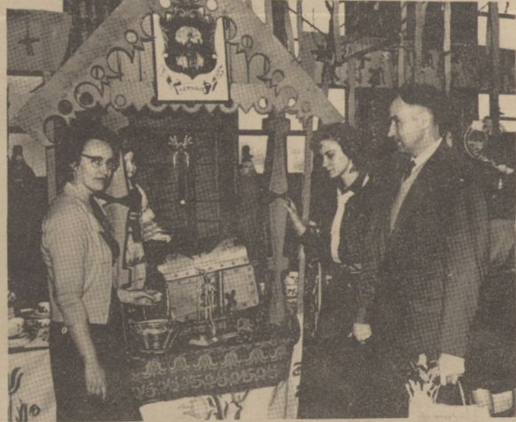
Kernavės skaučių tunto paviljonas Kaziuko mugėje buvo viliojantis savo paslaptinga lobijų skrynja, kuri, gaila, nebuvo pardavimui...

siūlo laimėti arba nelaimėti. "Meilėn papuolusių širdžių" loterija daugumoje aprūpinta "užsienietiškomis" prekėmis. Ant šniūrų kabo žaislai, riestainiai, silkės, o centre, grotoje tupi višta, kuri šalta lesinėja ir visai nesijaudina koks laimėtojas ją suvalgys. D.L.K. Vytenio dr. įrengusi meškerojų kam-