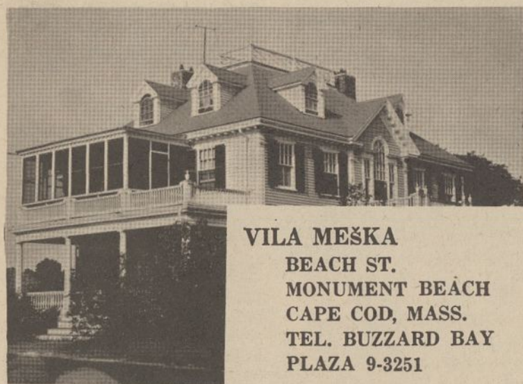
VILA MEŠKA BEACH ST. MONUMENT BEACH CAPE COD, MASS. TEL. BUZZARD BAY PLAZA 9-3251

Pasirėmus mokyto (dargi vyriškos giminės) lietuvių muzikologo J. Tchoulioutė (l'érudit musicologue lithuanian) teiginiams, kuris būk pirmas ištyręs krašto folklorą, hofmaniškose pasakose toliau aptariami liaudies muzikos instrumentai. Štai pirmiausia instrumentas, vardu "skouduotchias", kuris yra "sorlainietiškas ornamentais, šalia padėjo išmargintą skrynją, kiek panašią į kankles. Visai be reikalo kitoje aplanko pusėje tvirtinama, kad tos kanklės tik "panašios" į rusišką "gusli" instrumentą. Jeigu omeny turėta toji išmarginta lašinių patis, nėra reikalo savintis broliškos tautos dovaną.