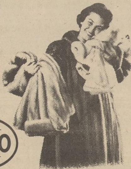
3 DALIŲ MINK APSIAUSTAS!

Pasirinkimas iš liuksusinių pilno ilgio paltų, tikrojo mink, puikios rūšies ir klasiško stiliaus.