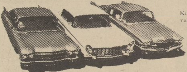
NAUJAS 1960 AUTOMOBILIS KIEKVIENĄ SAVAITĘ!

DAUGIAU KAIP 15,000 KITŲ SVAJOTŲ DOVANŲ IKI $1,000 VERTĖS