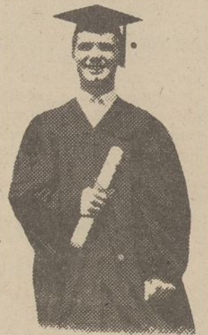
$4,000 COLLEGE STIPENDIJA! $4,000 apmokėti kolegijos mokslai. Laimėtojas pasirenka bet kokią kolegiją ar universitetą.

DAUGIAU KAIP 15,000 KITŲ SVAJOTŲ DOVANŲ IKI $1,000 VERTĖS