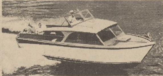
LIUKSUSINIS PARENGTAS KRUZERIS! 23 pėdų uždaras kruzeris su V-8, 185 HP motoras, sulenkiamas stogas, vandens pompa, kilnojama lempa ir kiti priedai.