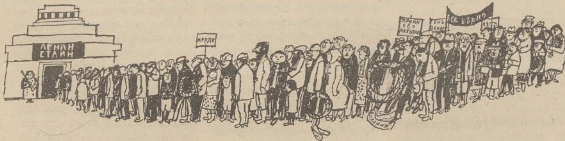
Begalinėje eilėje stovėjo žmonės prie Lenino mauzoliejaus.