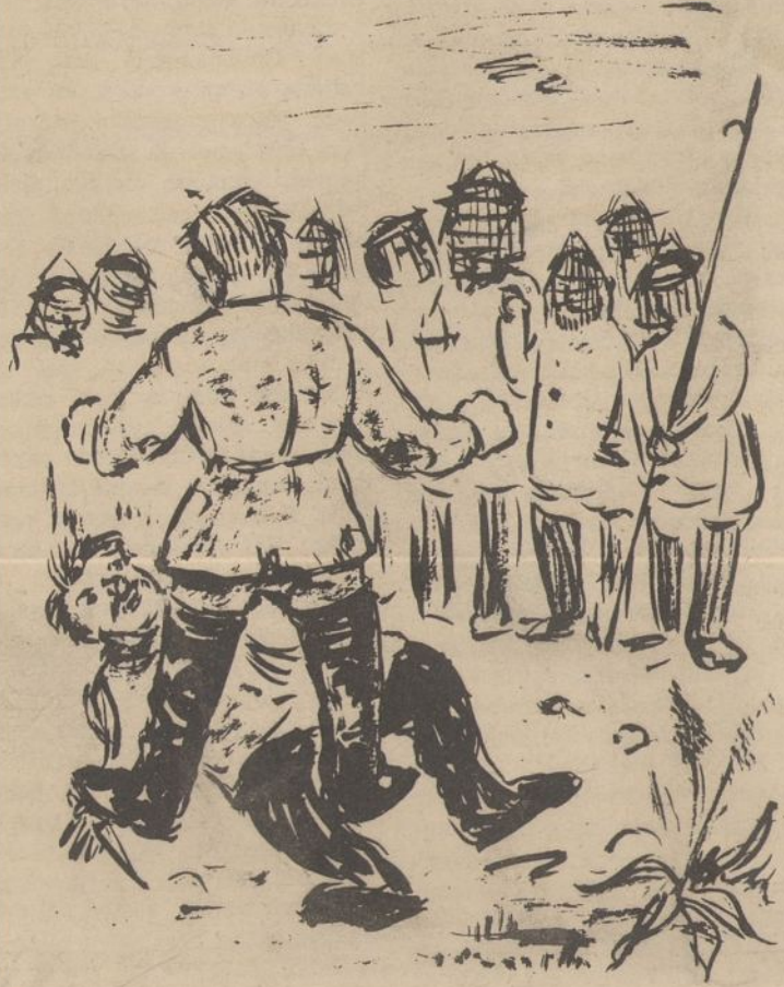
... Kaire koja priminu peilį laikančią ranką, dešinio bato kulnim išspiriu jį iš rankos...

Paėmęs peilį jį toli nusviedžiu į upę. Perbėgu akims stovinčius. Nepanašu, kad kas tarp mudviejų kištųsi. Jis atsistodė. Aš žinau, jeigu aš būčiau jo vietoj, jis mane būtų suspardeš kaip paskutinį šunį, versdamas atsiprašyti arba jų papročiu — bučiuoti batus.