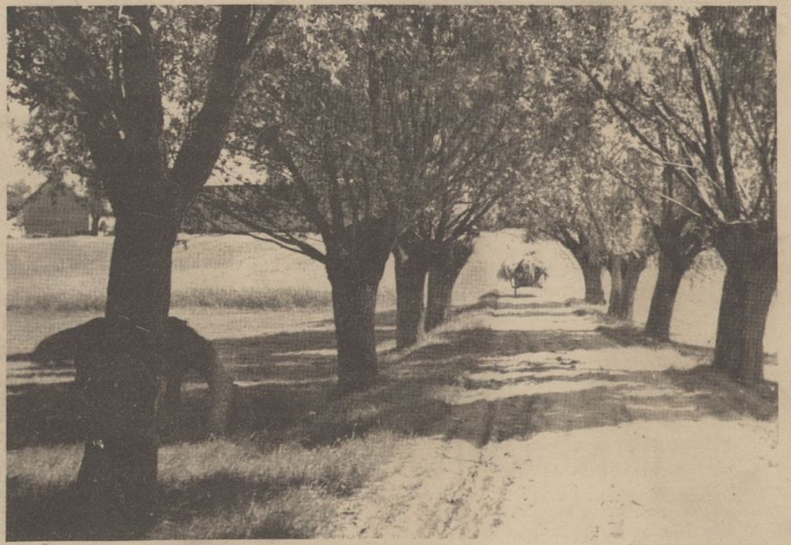
1944 metų vasarą Kybartų apylinkėje.

Stovim viens nuo kito tik per žingsnį. Jis dešinę ranką kiša į dešinę kelnų kišenę. Peilis, dingtelėjo man