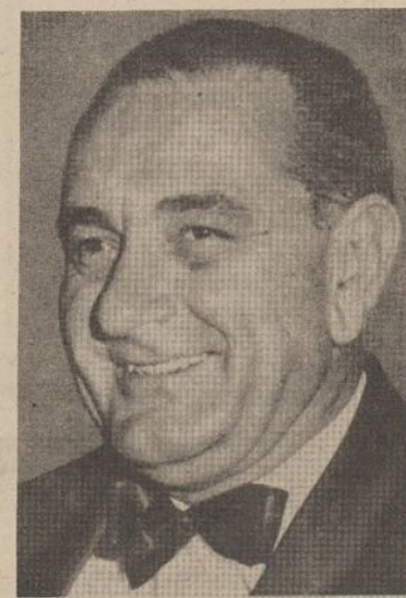
Sen. Lyndon Johnson

cijoje paskelbtą griežtesnę civilinių teisių programą, galėjusį per rinkimus dalį pietinių valstijų balsuotojų paskatinti atiduoti balsus už republikonus. Dabar tikima, kad Kennedy-Johnson "tiketas" sustiprins demokratų partijos galimybes laimėti ateinančius rinkimus.