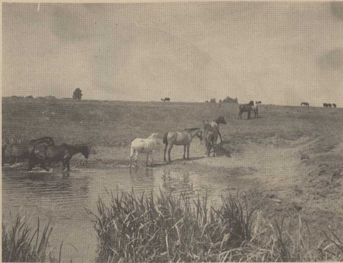
Prieš 16 metų Suvalkijos lygumose, Kybartų apylinkėje, dar nesimatė jokių artėjančios antros karo nelaimės ženklų. Nuotrauka daryta V. Blyno 1944 metais, prieš pasitraukiant į užsienį.

Prancūzija vis dar tebereikalauja nusiginklavimo pasiūlymų, kuriuos Vakarai, ypač JAV laiko pavojingais Vakarų karinėms pozicijoms ir Jungtinių Valstybių "atgrasinančiais jėgais".