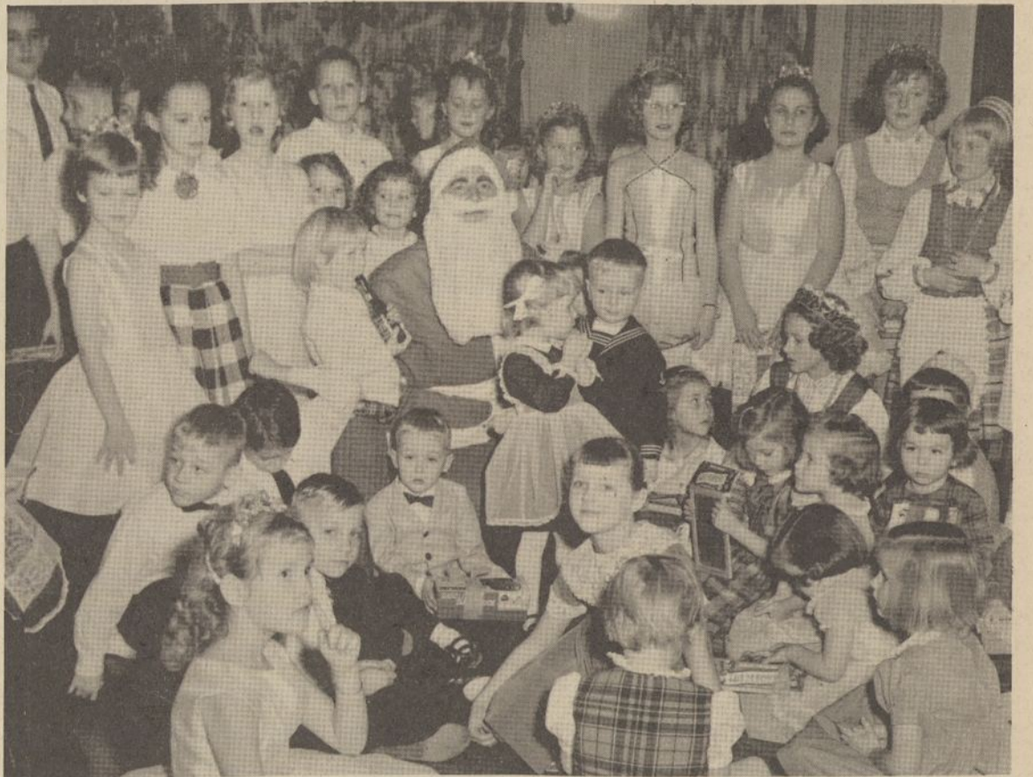
Clevelando Šv. Kazimiero lituanistinės mokyklos mokiniai su Kalėdų seneliu per Kalėdų eglutės parngimą.