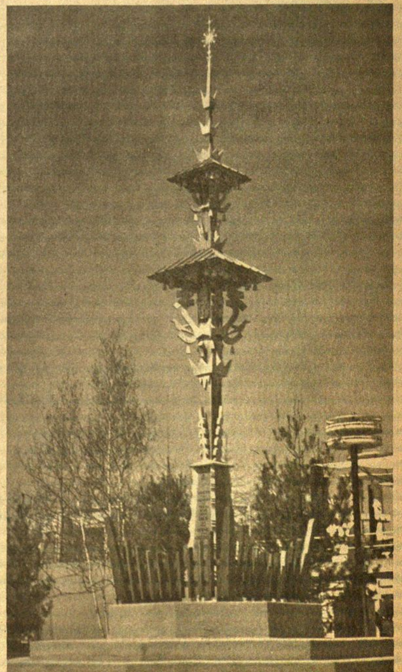
Lietuviškas kryžius pastatytas New Yorko pasaulinėje mugėje.

A. S. Trečiokas Spaudos-inf. kom. narys.