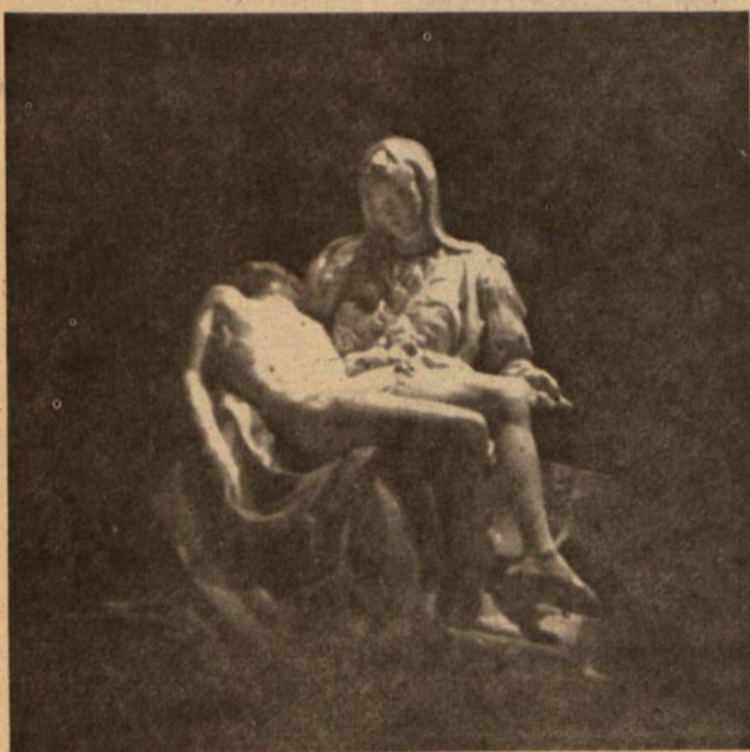
Į garsiąją Pietą mugės lankytojai Vatikano pavilione turi tik 75 sekundes laiko iš arti pažvelgti...