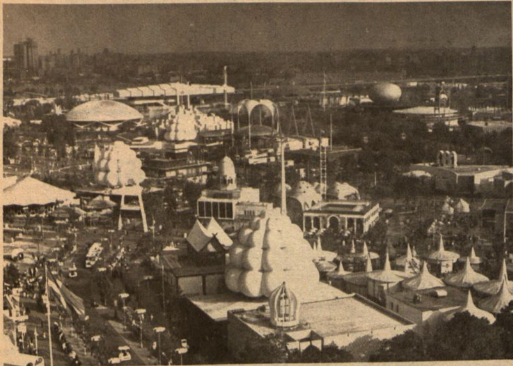
Pasaulinės mugės vaizdas iš viršaus primena pasakose įsivaizduotą pasaulį.