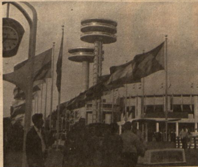
Pasaulinės mugės observatorijos bokštai, iš kur lankytojai gali stebėti mugę iš viršaus...

Tarp 9 v.v. iki 9.30 v.v. vadinamame "Fountain of the Planets" vyksta falerverkai. Tarp didžiulių fontanų, apšviestų įvairiaspalvėmis šviesom, muzikai grojant, fontanai šoka pagal muziką. Šoka ir falerverkai. Pabaigai sugroja "God Bless America". Gražu. Bet širdį suspaudžia prisiminus, kad visai netoli plėvesuoja raudonoji vėliava. O, tau ir "God Bless America". (v.b.)