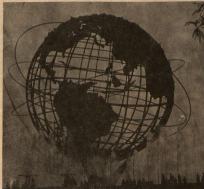
Milžiniškas gaublys su vandens fontanais.