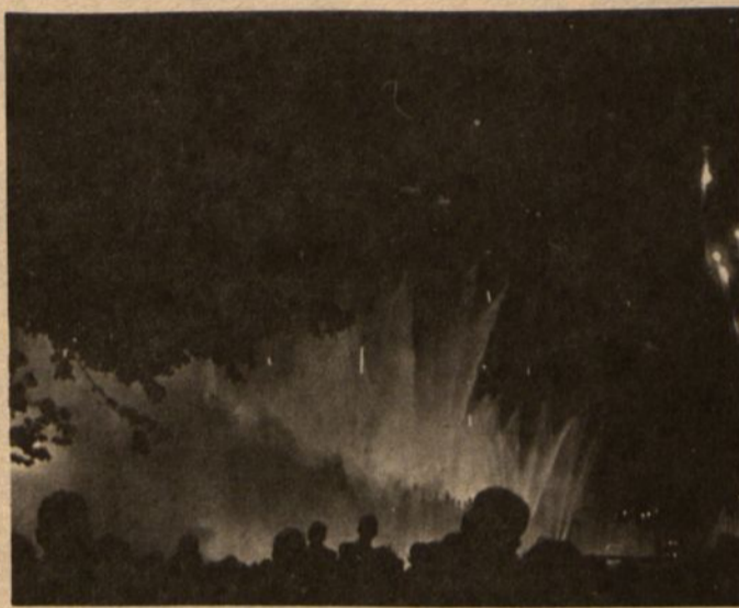
Vakare Pasaulinėje Mugėje būna spalvingų fontanų ir feierverkų spektaklis.