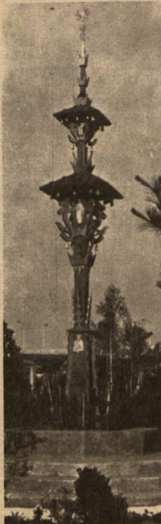
Lietuviškas koplytstulpis Pasaulinėje Mugėje New Yorke.

Sakau, kad ne aš statau. "Jūs atvežėt Šiluvos Mariją, mes jos