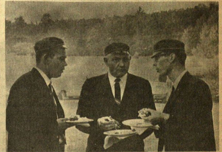
Būrelis neolituonų užkandžiauja stovykloje.

Šiluvos Kopyčia Amerikos šventovėje Washingtone bus šventinama 1966 m. rugs. 4 d. Ta proga Kunigų Vienybė nutarė sušaukti Pasaulio Lietuvių Religinę Kongresą. Kongresui paruošti paskyrė komisija, kuri sudarytu su pasauliečiais Kongresui Paruošti Komitetą. Komitetan yra pakviesti centrinių organizacijų atstovai.