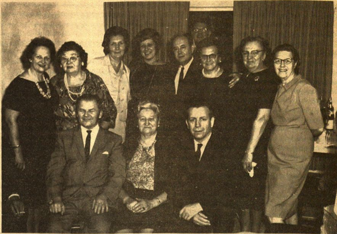
Grupė SLA veikėjų pas Dargius Pittsburghe.