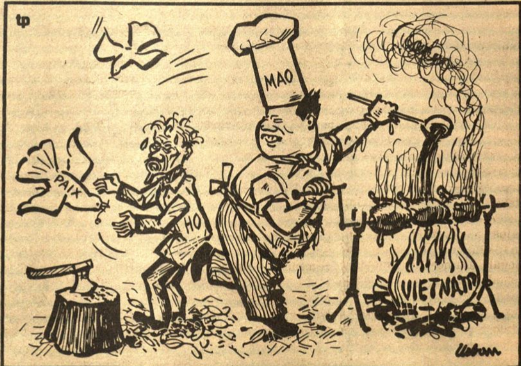
Mao: -- Paskubėk, drauge!