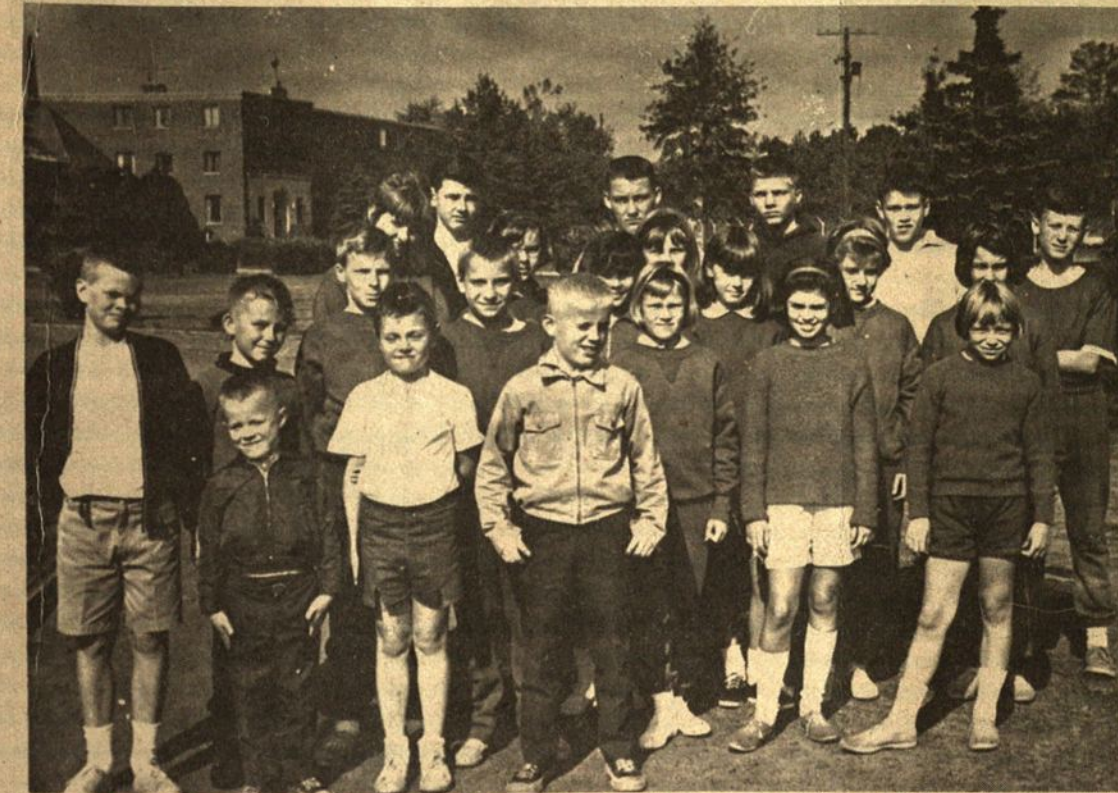
Šv. Kazimiero lituanistinės mokyklos Clevelande mokiniai dalyvavę spalio 17 d. sportinėse varžybose.

Kvietimai, kuriuos prašoma užsisakyti iš anksto, gaunami: Lietuvių Klube darbo valandomis ir pas direktijos narius.