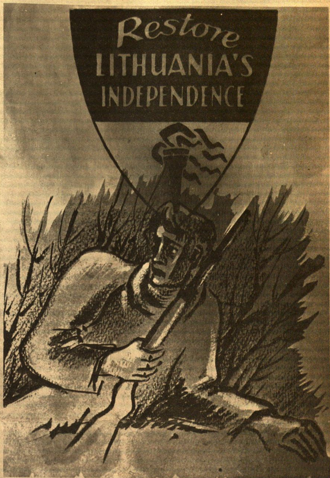
Partizanas paukuko gyvybę už tėvynę. Pagerbime jo šviesią atmintį, pašvęsdami bent dieną pareikšti Lietuvos solidarumą nepriklausomybei atstatyti. Pirmyn į Lapkričio 13 d. manifestaciją.

name"). Aviacijos dėka tos bazes neturi būti prie jūros pakraščių, bet gali būti ir kalnuose. Su penkių šimtų tūkstančių Vietnamo kariuomenės talka (vietnamiečiai ir dabar turi keturis kartus daugiau susirėmimų su komunistais negu amerikiečiai), Saigono vyriausybė kasdien savo kontrolėn gauna didelius plotus su dar daugiau gyventojų. Komunistų kontrolėje lieka sunkiau prieinamos vietos. Savaimė aišku, kad tokioje situacijoje gyven to jama s k o m u n i s t ų viešpatavimas darosi nepakenčiama našta, kuri sudaro grėsmę jų gyvybei ir turtui, todėl jie griebiasi visų prieinamų priemonių partizanais atsikratyti. Ir tie jau perbėga į vyriausybės pusę ne tik paskirai, bet būreliais ir atsieneša ginklų. Reiškinys, kurio visai nebuvo prieš ketelį mėnesių.