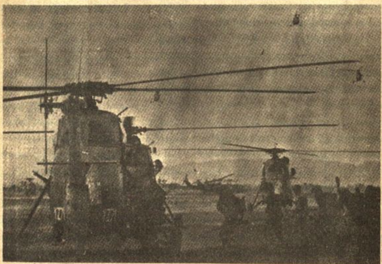
JAV helikopteriai padarė perversmą karo mene Vietname iš vienos į kitą vietą perkeldami didžiausius kariuomenės dalinius net su artilerija ir autovežimiais...

Technikos dėka per kiekvieną susirėmimą paprastai žūsta penkis kartus daugiau komunistų negu amerikiečių. Šiais metais skaičiuojama, kad komunistai neteks 27,000 karių, tuo tarpu pietų vietnamiečiai 12,000 (įskaitant apie 1,000 amerikiečių). Dėl tokio santykio šiaurės Vietnamas jau turi siūsti savo karius, vietinių partizanų jau neužtenka. Amerikiečių strategija buvo įsistiprinti tam tikruose atsparos punktuose ir iš jų plėsti savo įtaką. (Tai jau buvo aprašyta Dirvoje "Su mariniais Viet-