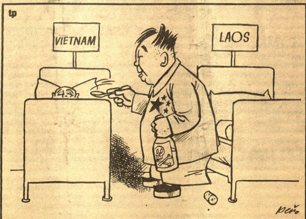
Mao: - Skubėk, aš dar kitam turiu duoti lašų...