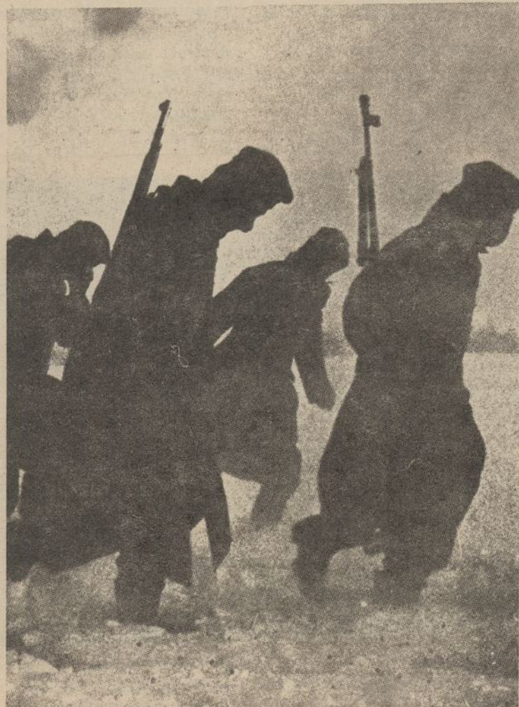
Vokiečių kareiviai nebuvo pasiruošę sunkiai Rusijos žiemai...