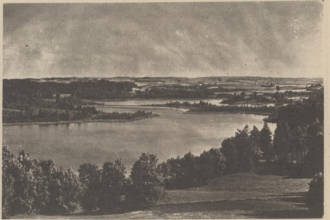
Pirties ežeras prie Smalininkų Vižainio apylinkėje. Ši apylinkė, plačiai lietuvių apgyvendinta, po II Pas. karo palikta Lenkijai.