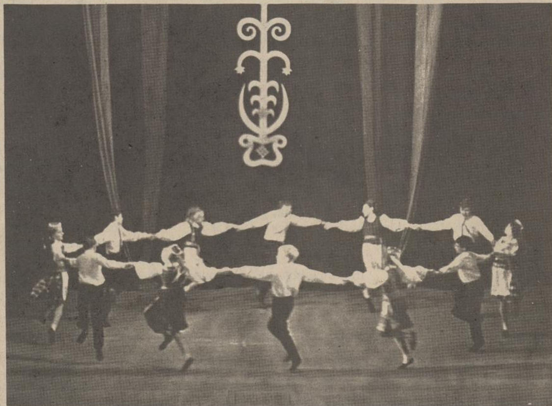
Vasario 16 Giminijos mažieji šokėjai Lietuvos nepriklausomybės atstatymo sukakties minėjime Weinheime, Vokietijoje, šoka kalvelį.