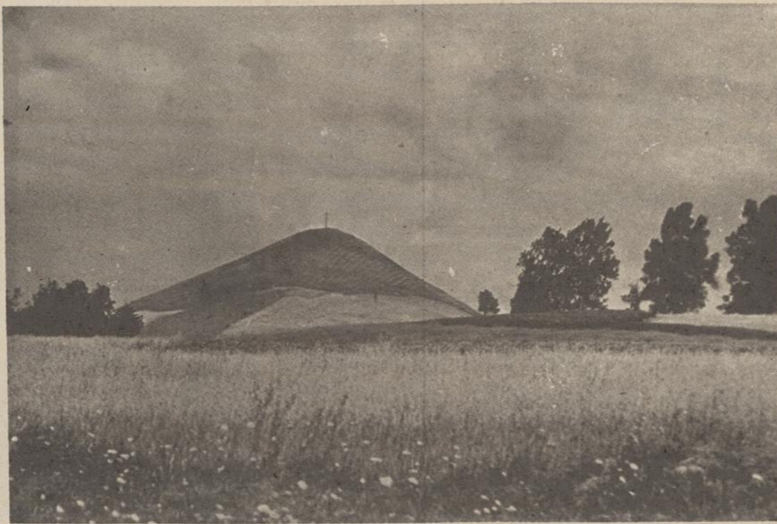
Čiso kalnas prie Gulbiniškių, senoje jotvingių žemėje.

Tai platus kelias, bet juo eiti privalo ryžtis didelis būrys veikėjų. Eiti privalo ne partizanškai, bet su visuomenės pasitikėjimu ir parama.