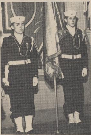
Šaunūs Bostono jūrų skautai garbės sargyboje.

Jubiliejinė ir stovykloje Jūros Diena bus švenčiama š. m. rugpiūčio 19-20 d.d. Šioms iškilimėms tikimasi