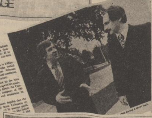
... during a short visit.