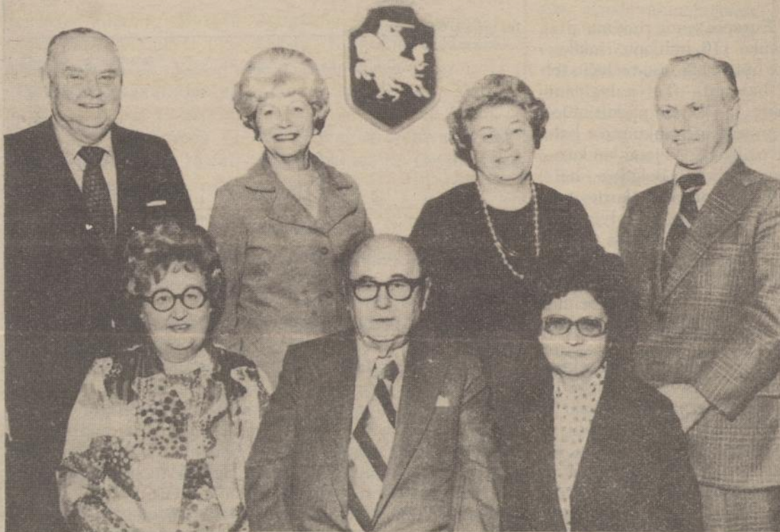
SUSIVIENIJIMO LIETUVIŲ AMERIKOJE PILDOMOJI TARYBA

Be to, jei - nepaisant visų bučinių - nėra pasitikėjimo, noras išlikti gyvam vers ieškoti priemonių susitarimo suvaržymams apeiti. Pats Carteris, norėdamas senato ratifikacijos, paprašė lėšų naujos MX raketos išvystymui, kuri būtų lengvai kilnojama iš vienos vietos į kitą ir tokiu būdu sovietams būtų sunku į jas nutaikyti ir pirmu smūgiu sunaikinti. Pagaliau technika dar nepasakė savo paskutinio žodžio ir dėl galimybės pagauti bei sunaikinti prieš raketą prieš joms pasiekiant taikinį. Iš istorijos žinome, kad apribojimas vienos rūšies ginklu, paprastai jau pasenusių - kaip didieji kovos laivai tarp abiejų pasaulinių karų, paprastai paskatina naujų ginklų ieškojimą. Už tai ir strateginių ginklų 'lygybė' be abejo paskatins to paties. Jau dabar NATO kraštai sutarė padidinti