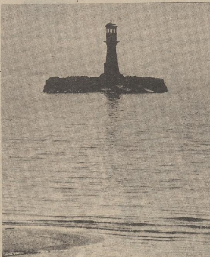
Kuršių marių švyturys.