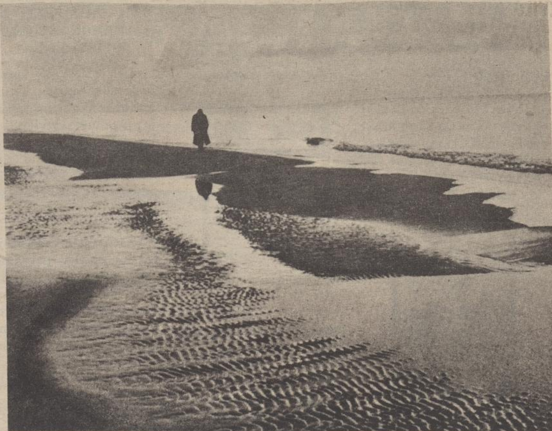
Prie Kuršių marių Neringoje...