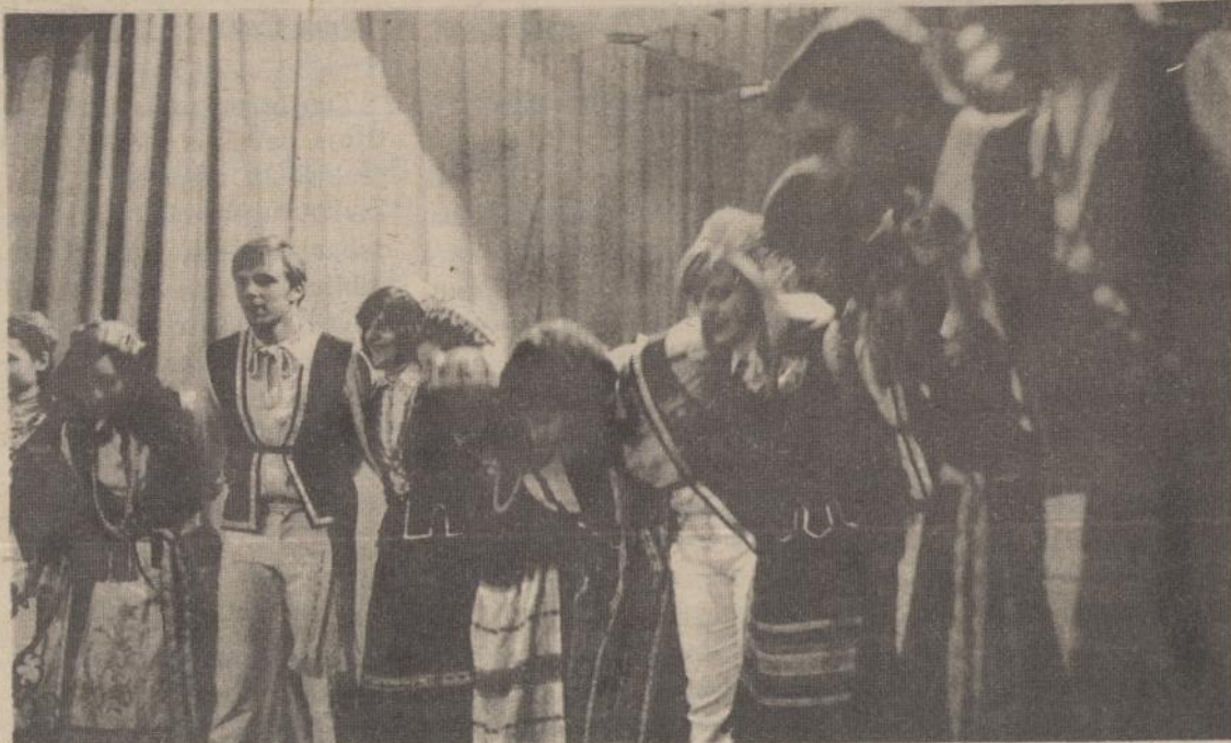
Berisso Mindaugo draugijos jaunimo šokių grupė šoka Simo Kudirkos apsilankymo proga, Argentinoje (1979. VI. 15).

Kolbenze dokumentų kalbančių bent apie 400.000 vokiečių išnaikinimą. 130.000 (Nukelta į 4 psl.)