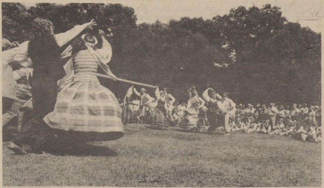
Tautiniai šokiai Lietuvių dienose Chicagoje.

Žmogus savo vertės pajautimo negali grįsti įsitikinimu, kad jo siela su žmogiškais polinkiais yra dvasia, kuri prigimties gelmių šaknis yra praradusi ir kaip koks šetoniškas pasibaisėjimas turi kelti maištą pasaulyje. Vokiečiai sakyti, kad tai žmonės, kurie "Der liebe nicht haben", — žmonės be meilės. Ir šitokie žmonės yra tarytum blogos naugės atplaišos siurpų sąskambį keliančios. Kai mes prisimename su koku įniršimu mūsų krašto okupantai naikino Lietuvos ūkį ir bedaliais tremtiniais paleido jos ūkininkus į Sibiro taigas. Okupanto viešas reikalavimas, kad Lietuvos ūkininkas atsižadėtų savo žemės ir savo tėvynės, ar tai nėra be meilės, šiurpus ir šaltas iš blogo metalo "medžiaginis dvasios" sąskambis. Tai yra tas nuasmenintas, sužalotas nesupratimas ūkininko profesijos, kurios dėka jis kruopščiai prižiūrėjo tėvynės laukus ir miškus. Ir tai darė