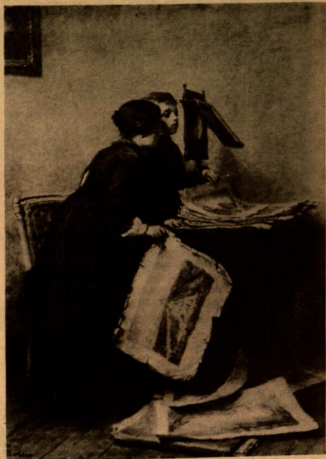
Pierre Edouard Frere — Vaikai žiūri paveikslus. Iš prancūzų realistų parodos Clevelando meno muziejuje.

Šią realistų parodą globoja Amerikos Humanizmo Sąjunga, Valstybinė meno ir Humanizmo Sąjunga ir