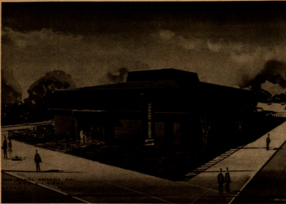
Naujieji Schuyler Savings and Loan Assn. namai, Kearny, N. J.