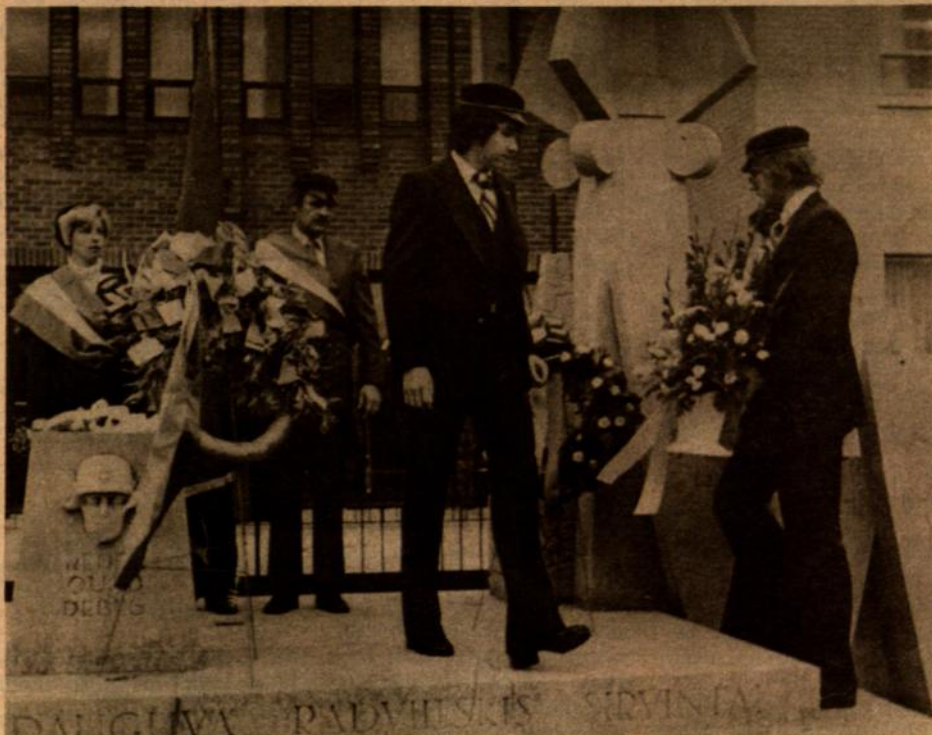
Korp! Neo-Lithuania šventės proga prie paminklo žuvusiems dėl Lietuvos laisvės, korporantai padėjo vainiką.