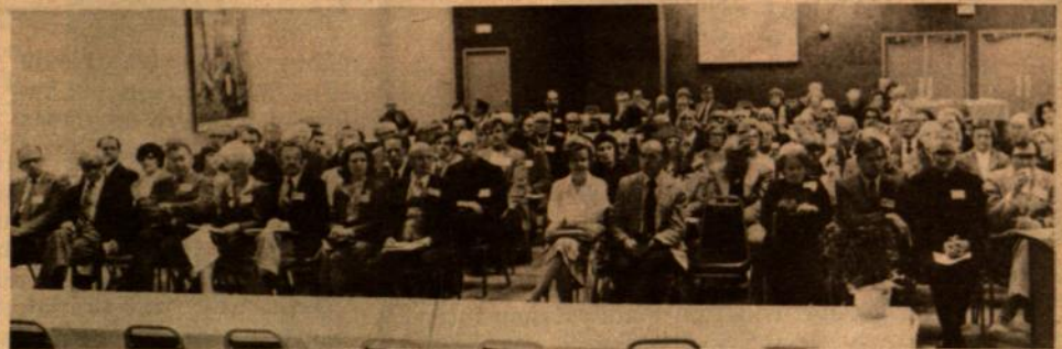
Kultūros darbuotojų konferencija Clevelande, Lietuvių Namuose lapkričio 22-23 d. buvo gausi atstovais bei svečiais ir sėkminga darbais bei nutarimais. Viršuje kalba prof. Tomas Venclova. Jo paskaita "Kultūros vaidmuo išeivijos butyje" buvo įdomi ir visų su dėmesiu išklaušyta. Apačioje dalis konferencijos dalyvių.