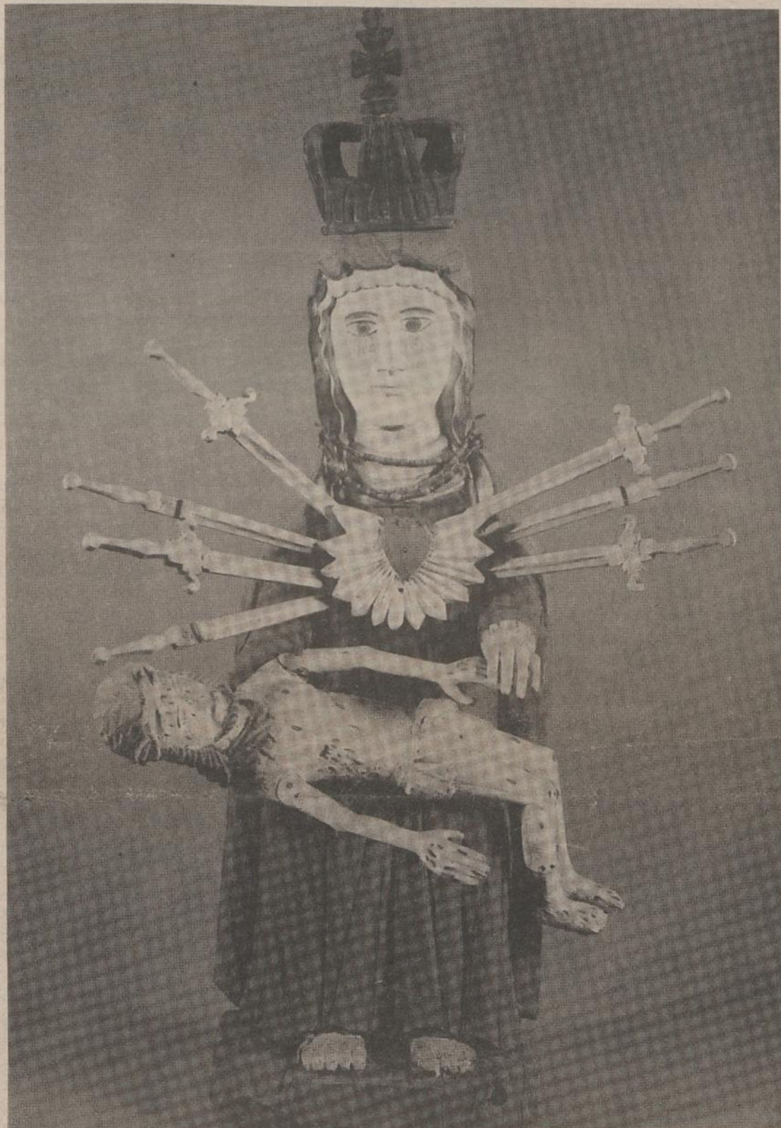
Neatpažinto Lietuvos dievdirbio skulptūra iš XIX amž. "Dievo Motina su Sūnumi".

Ta Kissingerio idėja nėra visai naua. Eina gandai, kad su ja 'žaidžia' ir prezidento paskirta komisija išspręsti MX likimą. Ir joje pasigirdo panašių pasiūlymų.