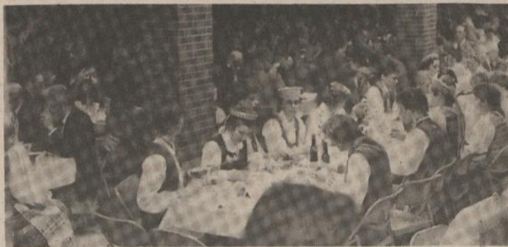
Po koncerto įvyko vaišės...