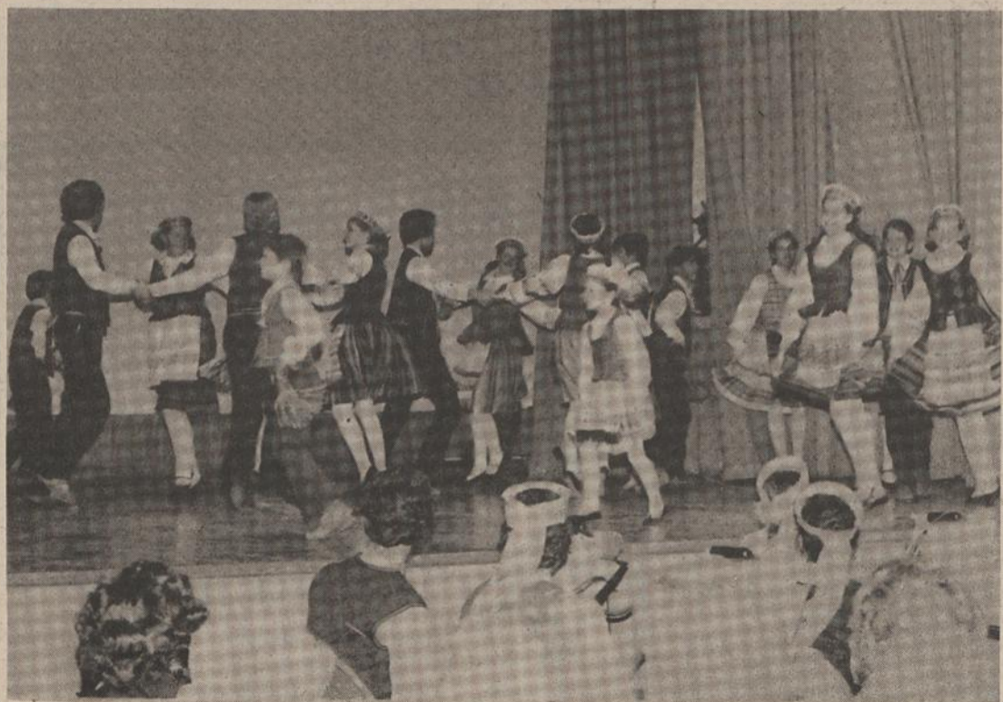
Jaunieji Grandinėlės šokėjai šoka...