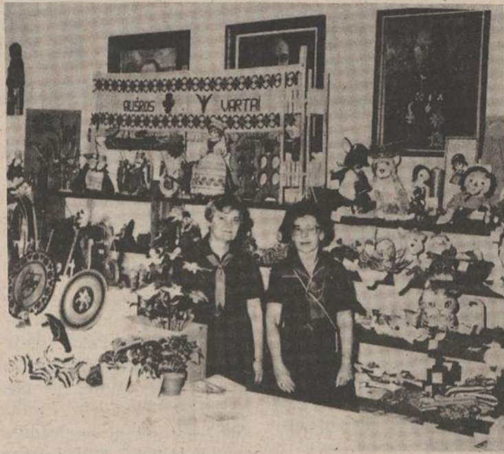
Aušros Vartų tunto paviljonas.

Skyrius pavadintas "Smetonos režimo kritimas (upadek). Lenkų tautybės padėties kaita". Maža straipsnio dalis skirta pačiai temai. Didesnėje jo dalyje kalbama apie lietuvių studentus, paminint jų išsišokimus net bažnyčiose, apie lietuvių maldininkų ekskursijas į sostinę ir ypač smulkiai aprašoma prezidento planuotas pirmas atsilankymas Vilniuje. Aprašas baigiamas posakiu lyg ant patyčių: "O vis dėlto Smetona kaip prezidentas Vilniaus niekuomet neaplankė. Birželio 15 dieną apėjo Lietuvą ir pabėgo į Vokietiją". O bėgo jis ryšium su Sovietų nota, "kaltinusi Lietuvos vyriausybę 1939. X. 10 sutarties laužymu" (p. 326). Pridurmai paminimi du Sovietų notos reikalavimai: sudaryti naują vyriausybę ir įsileisti neribotą kariuomenės kiekį, pakankamą Sovietų-Lietuvos sutarčiai vykdyti. Po to seka sakiny: "Birželio 17 d. sudaryta liaudies vyriausybė su pirmininku Justu Paleckiu". Taip nusakydamas Lietuvos įjungimą į Sovietų Sąjungą, autorius seka žymia dalimi sovietinė istoriografija bet ne visai. Jis neverta žodžio "revoliucija", kur tariamai sukilusi liaudis nuvertė Smetonos vyriausybę, kaip sovietiniai istoriografai postringauja. (Verta paminėti — kad ir nukrypstant nuo temos — teiginį žurnale "Voprosy istorii", nr. 11, 1982, kur netaikomas revoliucijos žodis Pabaltijo įvykiams. Štai kaip skamba teiginys: "1940 m. Lietuva,