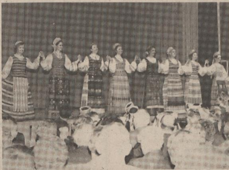
Grandinėlės "alumnai" šoka...