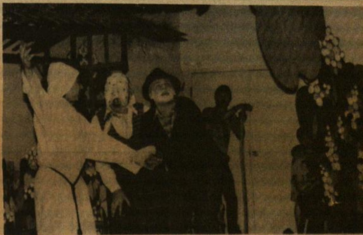
Pilėnų tunto suruoštame blynų baliuje vasario 9 d. skautai suvaidino vaidinimėlį "Pupa". Rež. A. Miškinis.