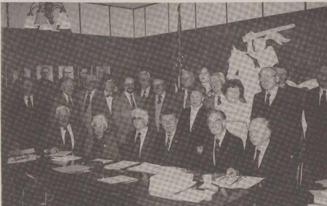
Dalis Vliko tarybos narių, posėdžiavę š.m. sausio 13 d. Chicagoje.