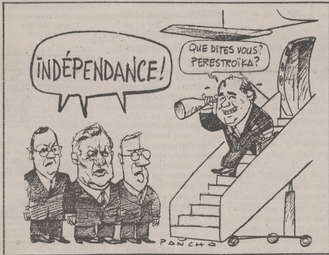
Gorbačiovas: - Ką jūs sakote? Perestroika? Brazauskas ir Co.: - Nepriklausomybė!