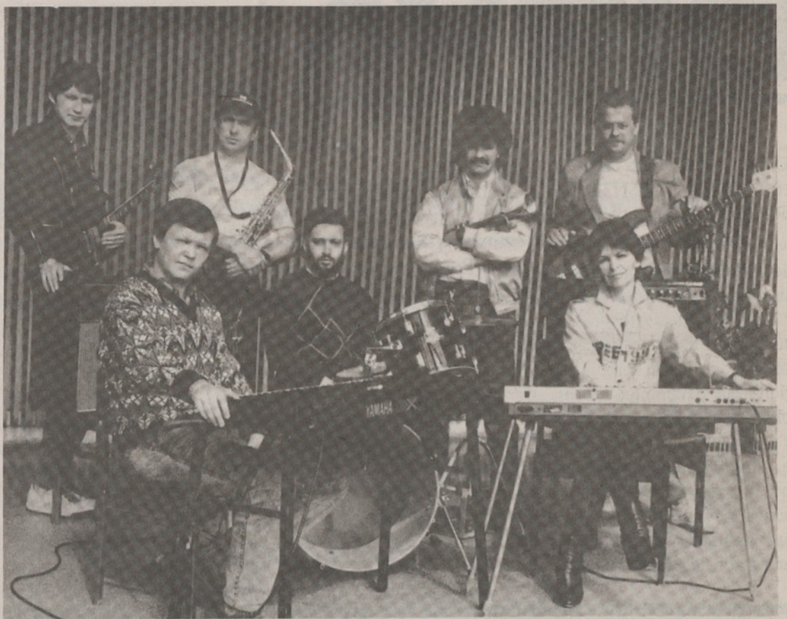
Vilniaus pramoginės muzikos ansamblis "Oktava", kuris koncertuos Clevelande vasario 4 dieną.