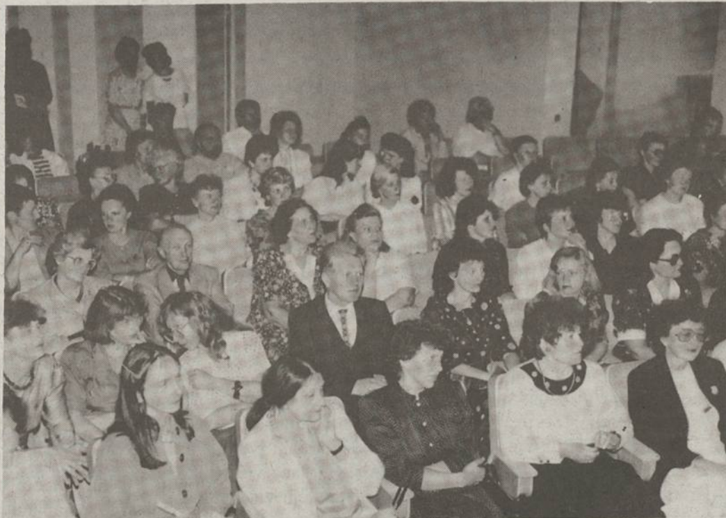
Lietuvos mokytojai suvažiavę iš įvairių vietovių dalyvauja atidaryme Tobulinimosi Instituto salėje.

Žinau šeimas, kurios savaitgaliais po 60 mylių (į vieną pusę) vaikus į mokyklas vežiojo. Visa išeivija gali didžiutis, kad iš lietuviškų mokyklų išėję jaunuoliai, dirba prie Jungtinių Tautų ir Washingtone Lietuvos amba-