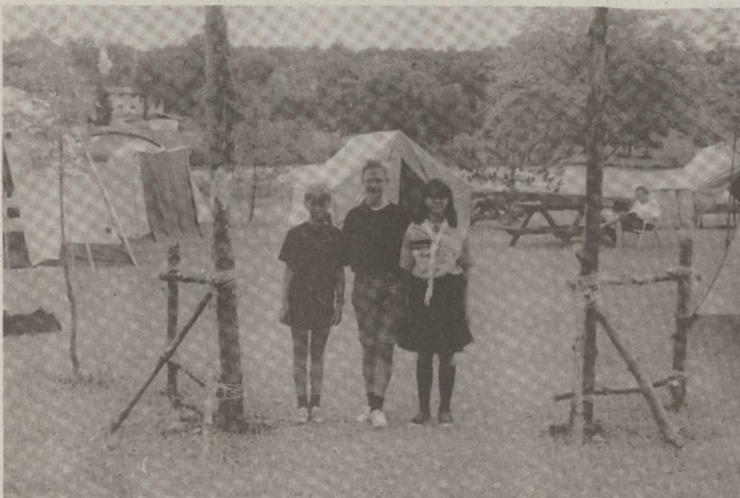
Vartus pastačius, galima ir nusifotografuoti įrengtos stovyklos fone.