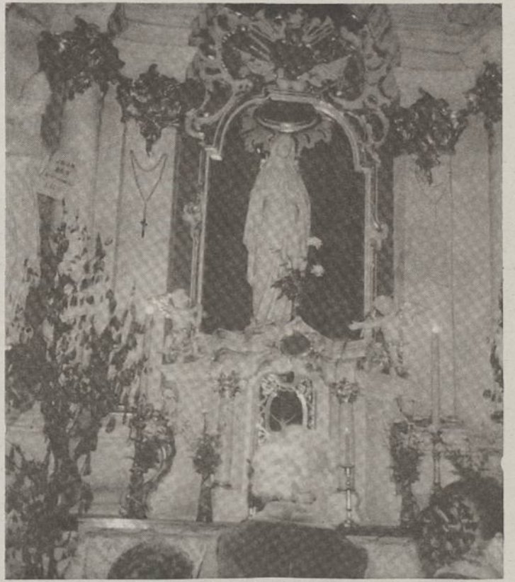
Tytuvėnų (Kelmės rajone) bažnyčios, kuri yra viena iš gražiausių Lietuvoje, šoninis altorius pašvęstas Marijos garbei.