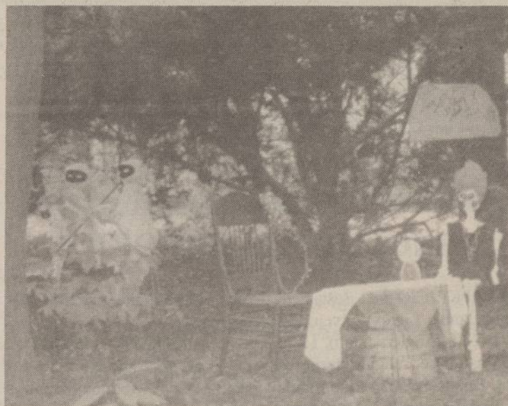
Ruošiantis Halloween dienai, sodybos "puošiamos" vaiduokliškais dalykais