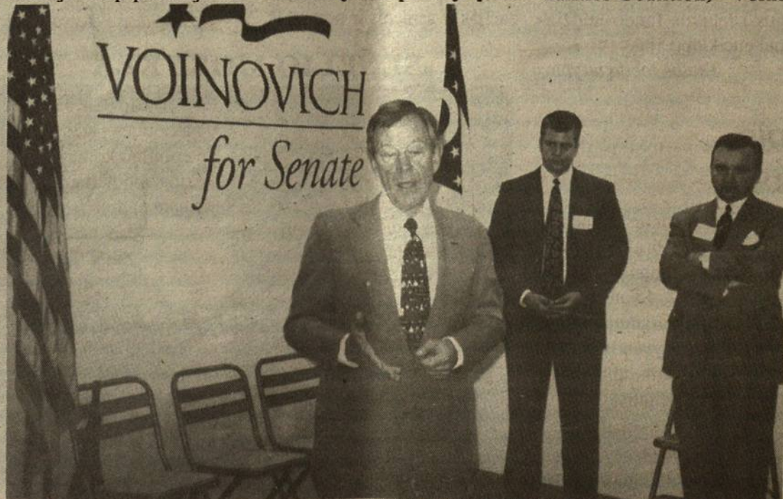
Ohio gubernatorius G. Voinovich tautinių bendrijų atstovams praneša apie savo kandidatavimą į Senatą.