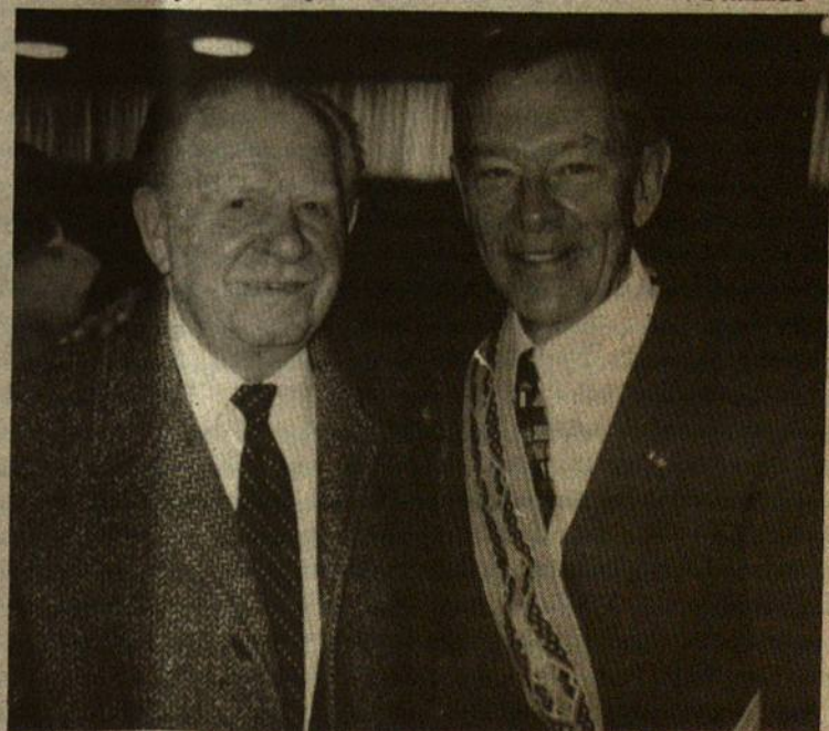
Ohio valstijos gubernatorius G.Voinovich Dievo Motinos parapijoje sutiko savo seną pažįstamą ir rėmėją Igną Stankų.