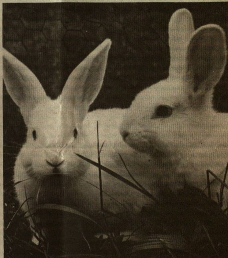
"Kokios Velykos be zuikučių?", - klausia šios nuotraukos autorius R. Kisielius?