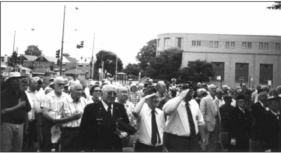
Organizacijų atstovai ir lietuvių visuomenė pagerbė S. Darių ir S. Girėną Čikagoje prie jų atminimui pastatyto paminklo.