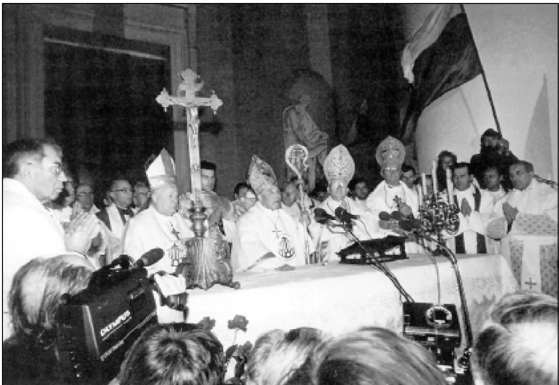
Šv. Mišias tikintiesiems prie gražintos Katedros laiko kardinolas Vincentas Sladkevčius. Vilnius, 1988 spalio 23 diena.