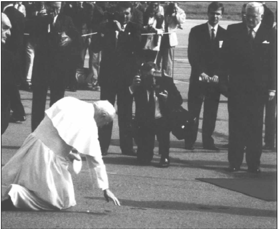
Istorinis įvykis, kai Šventasis Tėvas Jonas Paulius II 1993 m. rugsėjo 4 d. pirmą kartą atvykęs į Lietuvą bučiavo Lietuvos žemę.