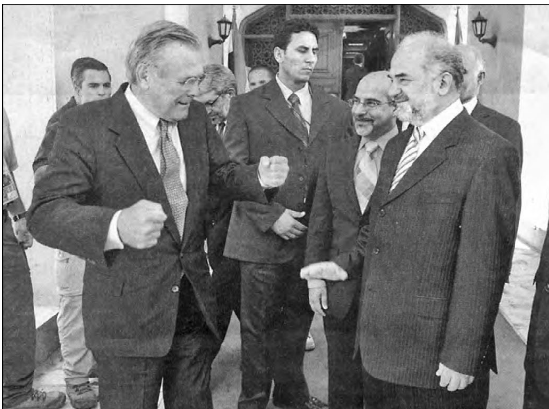
JAV Gynybos sekretorius Donald H. Rumsfeld, kairėje, dažnai lankosi Irake. Pastarojo vizito metu, atsisveikindamas su Irako ministru pirmininku Ibrahim al-Jaafari, dešinėje, prašė padaryti viską, kad konstitucija būtų priimta iki rugpjūčio 15 d.

Lietuvių grįžimo į tėvynę informacijos centras