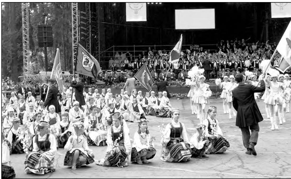
Kauno rajono dainų šventės momentas.

Dainų ir šokių šventėje išvardinti visus dainininkus, šokėjus ir orkestrus būtų sunku, jų buvo tiek daug: 4 suaugu-