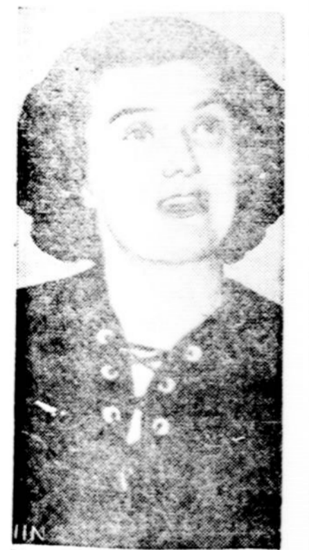
Čia yra parodyta Winnie Ruth Judd, kuri už žmogaus nužudymą Arizonoje yra nuteista kalėjimui. Nėštai senai ji iš kalėjimo pabėgo, bet šiomis dienomis vėl sugauta.