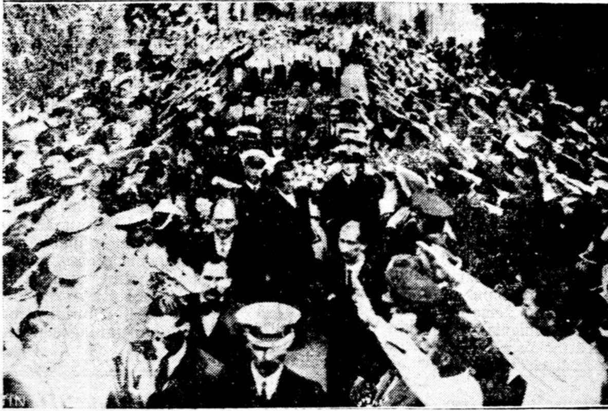
Šis vaizdelis parodo susprogdinto nacių karo laivo "Spee" kapitono Langsdorfo laidotuves Argentinoj. Susirinkę Buenos Aires miesto vokiečiai atiduoda jo karstui paskutinę naciską salūtą. Nuskindinę savo laivą, kapitonas Langsdorf nusišėvė. To laivo jūrininkus Argentinos valdžia internavo.

vo skaitytojus atbulomis žiniomis. Jeigu finai atmušdavo rusų atakas, nuydavojus atgal, tai "Laisvė" rašydavo, kad raudonoji armija "eina šturmu pirmyn." Bet galų gale ji išitinkino, kad tokios žinios stato ją ant pajuokos. Todėl dabar ji pradėjo vengti žinių apie Finijos žmonių kovas, o rašo daugiau apie Vilnių, apie Vilnijos lietuvius. Bet žmonės supranta tą "laisviečių" išsiskolinimą ir juokiasi iš jų "strategijos."