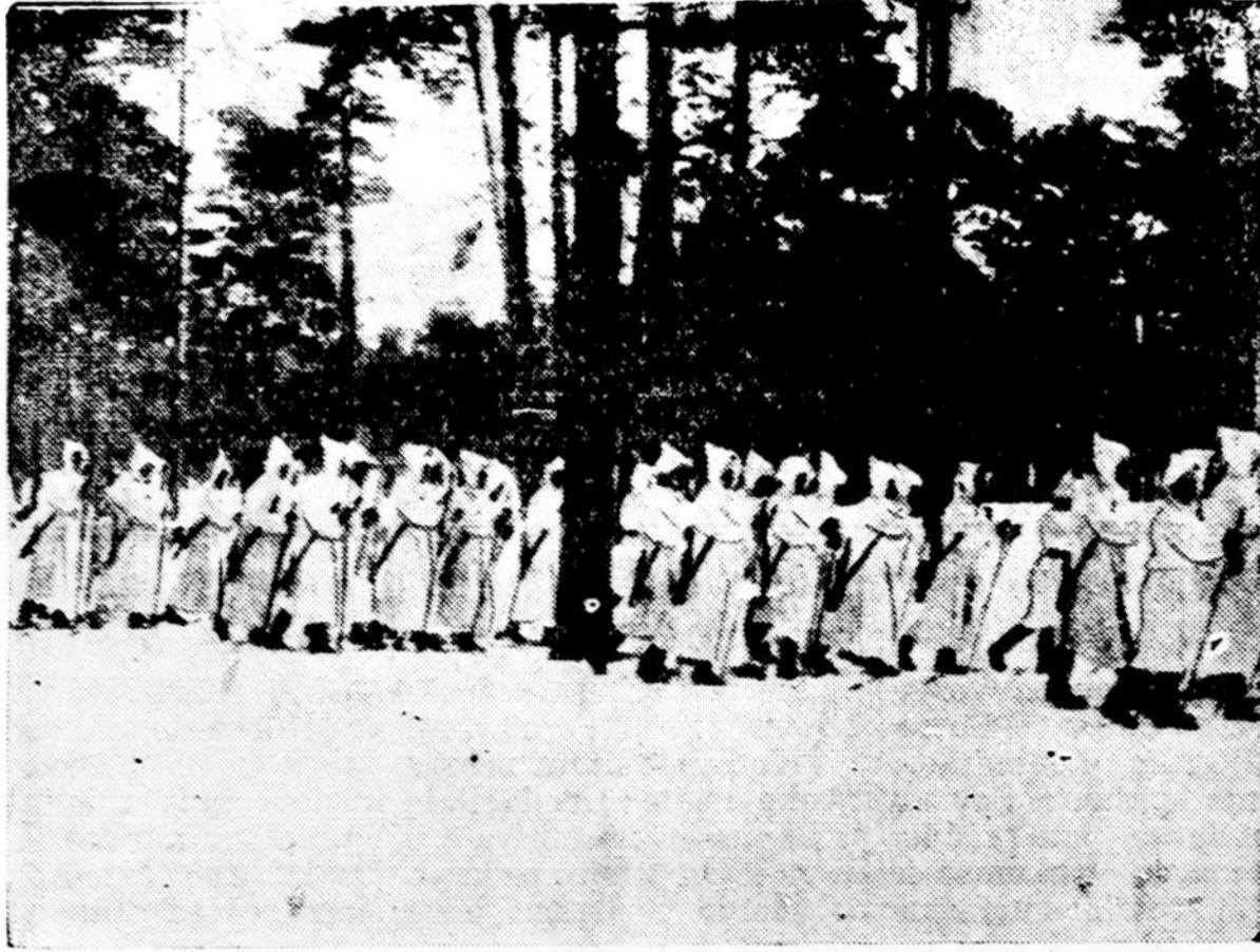
Suomijos respublikos gynėjai žiemos laiku yra apsirengę baltais apsiaustais ir gopturomis, kas padaro juos beveik nematomais ant sniego. Paprastai jie bėna ginkluoti lengvais kulkasvaizdžiais, automatiškais šautuvais, greitai šaujamais pistoletais ir žirglėmis, ant kurių jie laksto sniego paviršium kaip viesulas.