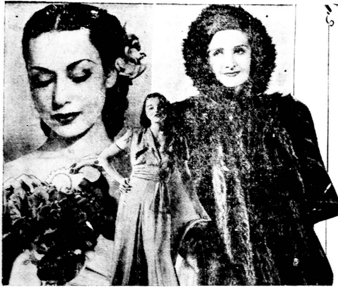
Pirmu kartą madų istorijoje moterys pradėjo dėvėti šunlukių (raccoon) kailinius prie vakarinių slėbių. Sunluokio kailis turi ilgą ir šiurkštų plauką, ir iki šiol iš tokių kailių buvo siūvami daugiausia vyriški kailiniai sofieriams, arsa sporto tikslams.