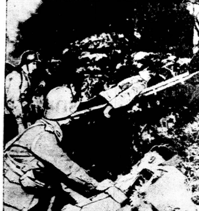
Čia matome Suomijos nepriklausomybės gynėjus nešant savo sužeistus draugus Karelijos fronte. Paveiksliūs prisijustas Amerikon per rodija.