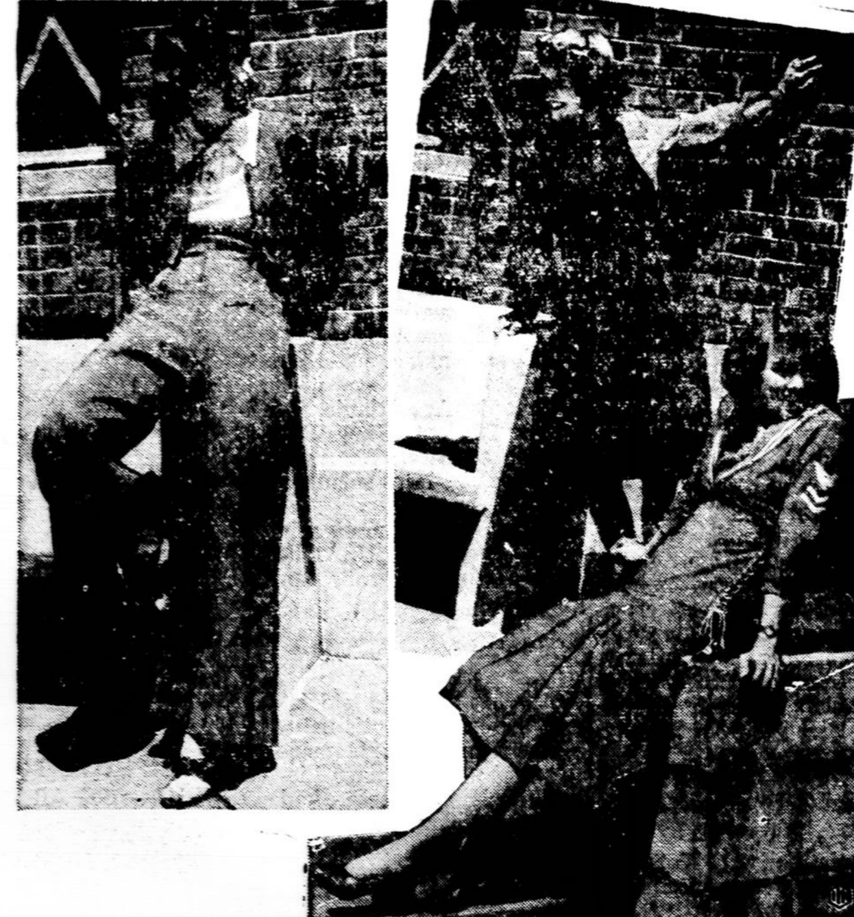
Vasaros atostogoms baigianties ir mokyklų sezonui besiantant, madų kurėjai jau pradeda skelbti naujas madas kolegijų studentėms. Šiame vaizdely yra parodyti trys kostiumų pavyzdžiai.