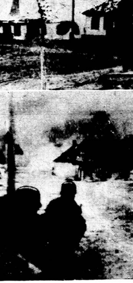
Šio nuotraukoj parodytas vokiečių bombomis sunaikintas Sovietų Rusijos miestelis, kurio vardas nepaduodamas. Atvaizde matosi dar ruktą dumai.