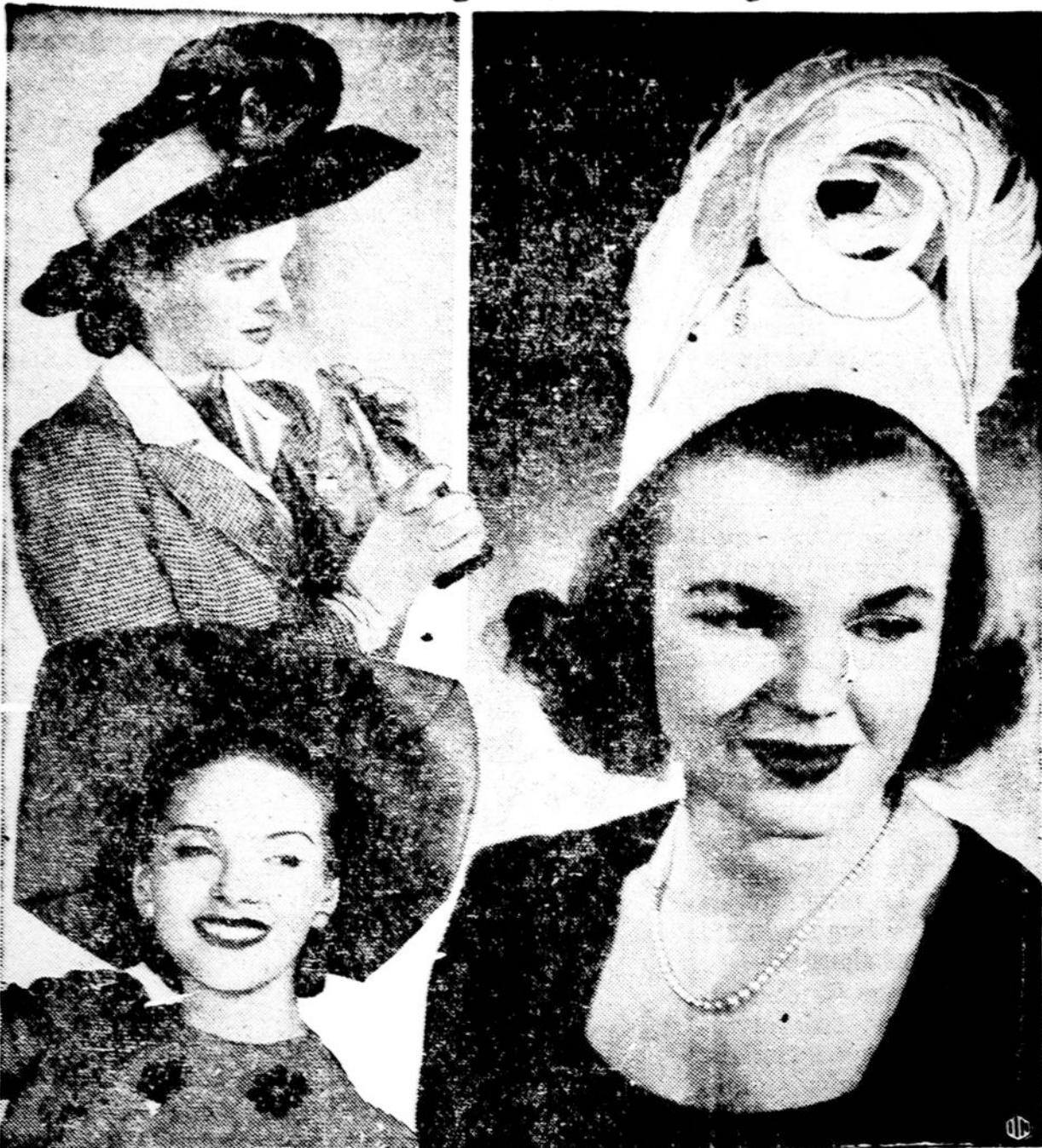
Mažų kurėjams kartais prituoka rimtų motiųjų ir, vietoj gracijos, pas juos išeina baidyklės. Negeria išrodo ir vėliausios mados skrybelės, kurių čia parodom keliatą pavyzdžių. Nesinori tikėti, kad moterys norėtų tokias šlykštybes dėvėti, ypač kaip dvi žemutinės.