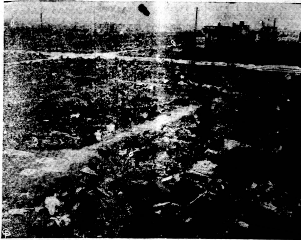
Stai kaip šiandien išrodo ta vieta, kur da neseniai stovėjo Japonijos sostinė Tokijo. Dabar tenai riogso tiktai kruvos pelenų ir griuvėsių.