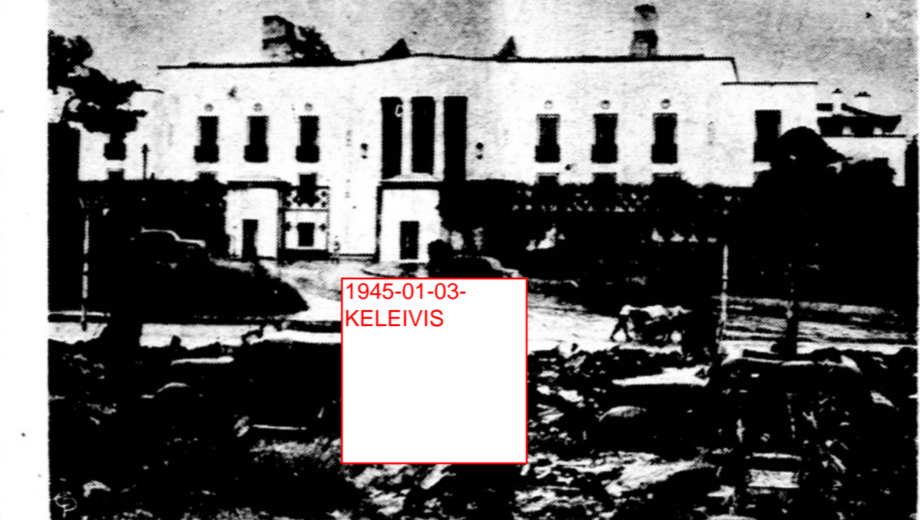
Ši nuotrauka parodo Jungtinių Valstijų ambasadą Tokio mieste. Per karą "Baltieji Rumai" tenai nedaug tenukentėjo. Bet automobiliai priešaky matosi sudaužyti. Dabar čia bus generolo MacArthur'o štabo raštinė ir iš čia amerikoniai valdys Japoniją.