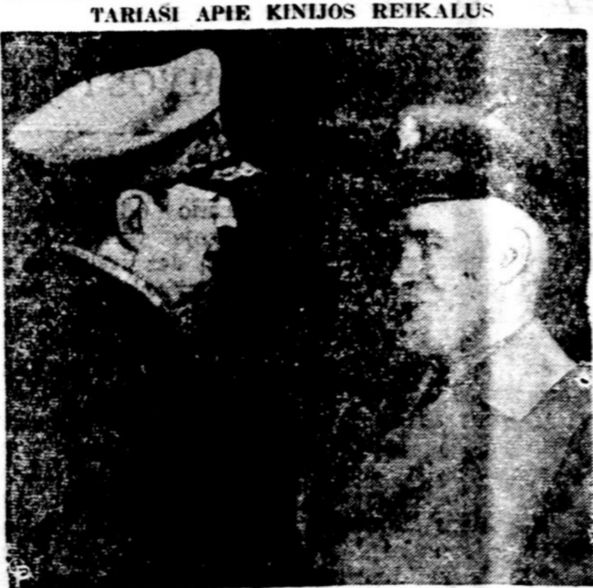
Tokio mieste, Japonijoje, generalas MacArthur tariasi su jungtinių štabų pirmininku, generolu Omar Bradley...