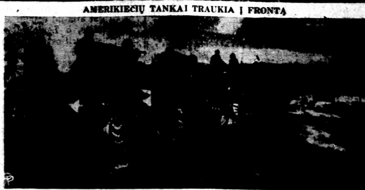
Šiaurinės Korejos kareiviai gavo iš Rusijos kelis šimtus sunkiųjų tankų. Dabar ir amerikiečiai atgabeno daugiau savo tankų į Koreją ir kova nebėra toki nelygi, kaip pirma.

Man įdomu buvo, kaip "opozicionieriai" žiūrį į Koreją. Iš angarietinių pasisakymų atrodo, kad jie daugiau tiki į policininko lazda išdavikų lizdai išgaidinti, kaip į savo pačių pastangas užkirsti kelią išdavikams tęsti judosišką politiką. Aš pasiuliau, kad angarietiniai išėitų viešai protestuodami prieš vaidmainišką "Laisvės" reikalavimą, kad korejiečiai būtų palikti "patys sutvarkyti savo reikalus." Bet opozicija tiek yra išsidėvėjusi, kad žmonės, patys žinodami kad dirba išdavikišką darbą, nebesuranda drąsos