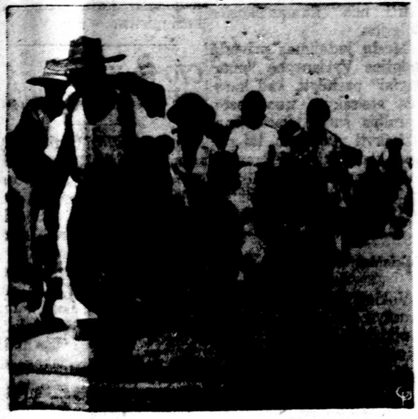
Vaidas iš Korėjos, kur šimtai tukstančių žmonių bėga į pietus nuo bolševikų armijų. Jau milijonus tokių pabėgėlių susirinko pietinėse Korėjos lukuose. Pabėgėliai užvenkia kelius ir kartu su jais bolševikai slūgsta savo šnipus ir perrengtus kareivius.