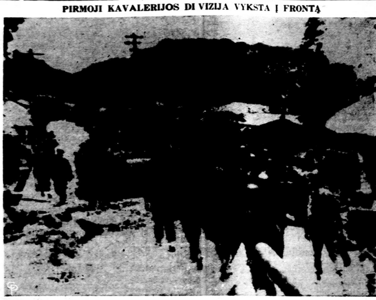
Tankai ir pėstininkai, pirmosios kavalerijos divizijos dalis, traukia į frontą. Toji divizija dabartiniuose mušiuose laiko patį kruviniausią fronto barą ir jau sudėjo daug aukų kovoj už laisvę.

Praeitą savaitę Anglijos vyriausybė paskyrė 100 milijū svarų sterlingų ginklavinimui reikalams. Anglijos ministerių pirmininkas C. Attlee sekmadienio vakare kalbėjo per radio ir įspėjo anglus, kad "Korejos gaisras gali sudeginti jusų namus" ir kad butina yra apsaugoti. Ginklavinimas, sakė ministerių pirmininkas, pareikalaus aukų iš visų gyventojų. C. Attlee dar įspėjo visus anglus saugotis vidaus priešų, sabotazninkų ir šnipų.