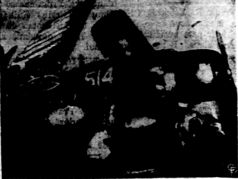
Orlaivių nešiotojų dėnyje į orlaivį kraunamos bombos gabenti į frontą prieš prieš. Orlaivių nešiotojai dabar veikliai dalyvauja Korejos kautynėse.