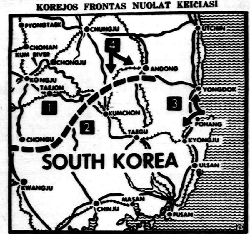
Korejos frontas dar nėra stabilizuotas ir šitas fronto žemėlapis dabar jau yra pavėluotas, nes mušiai eina kitose vietose.

Tokio veidmainiško dokumento tautų santykiuose reikia paieškoti! Tokį slykštų dokumentą galėjo drąsiai pasirašyti Hitleris, Mussolinis arba kuris kitas agresorius ir veidmainis.