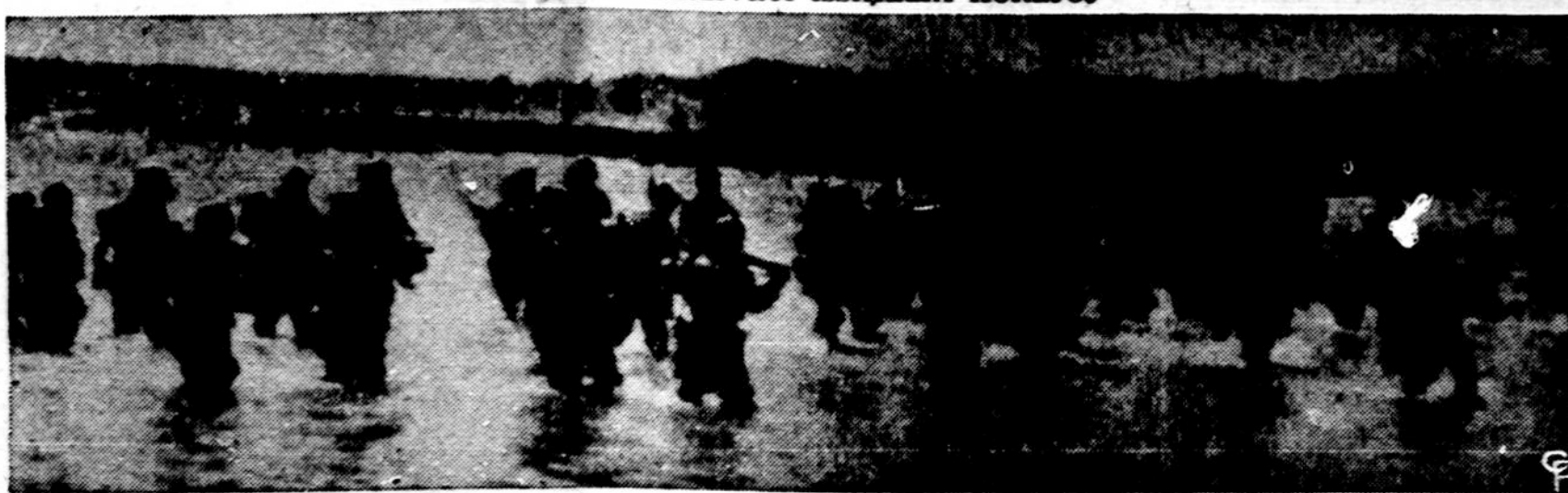
Prie Pohang, Korejoj, amerikiečiai iškėlė iš laivų į pakraštį ištisą kariuomenės divizioną be uosto priemonių pagalbos. Nuotrauka duoda vieną kareivių išsikėlimo vaizdą. Tie kareiviai jau kaujasi Korejos fronte.

Penicilinas ne viskas. Atsimeni, kai BALF'as rinko drabužius suselpti dipukus, tamsta, prieteliau, gal ir iš varžybų jausmo kaippo nuoširdus komunistas, gal ir norėdamas padėti savišiams Lietuvoj, tur but esi pasiuntęs atliekamą drabužį broliui, tamstos žmonai ir vaikams. Manai, gavo? Tikrai pasakysius, kad negavo; pasiųstus drabužius skirstė komunistų partija ir skirstė tiems, kurie yra "nusipelnę" komunistams, o ne paprastiesiems žmonėms, kaip tamstos brolis ir jo žmona. O penicilino. Nuo to pasakymo netekau kvapo. Aš gerai pažinojau kupiškėno dė-