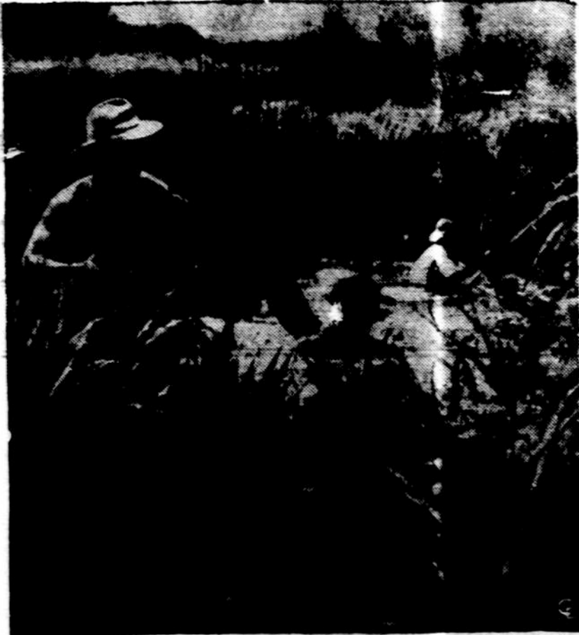
Ne tik Korejoj, bet ir Indokinijoje eina karas. Paveiksle matyti, kaip prancūzų kareiviai pagauna vieną anamitų partizanų būlę ir jį nugaldo.