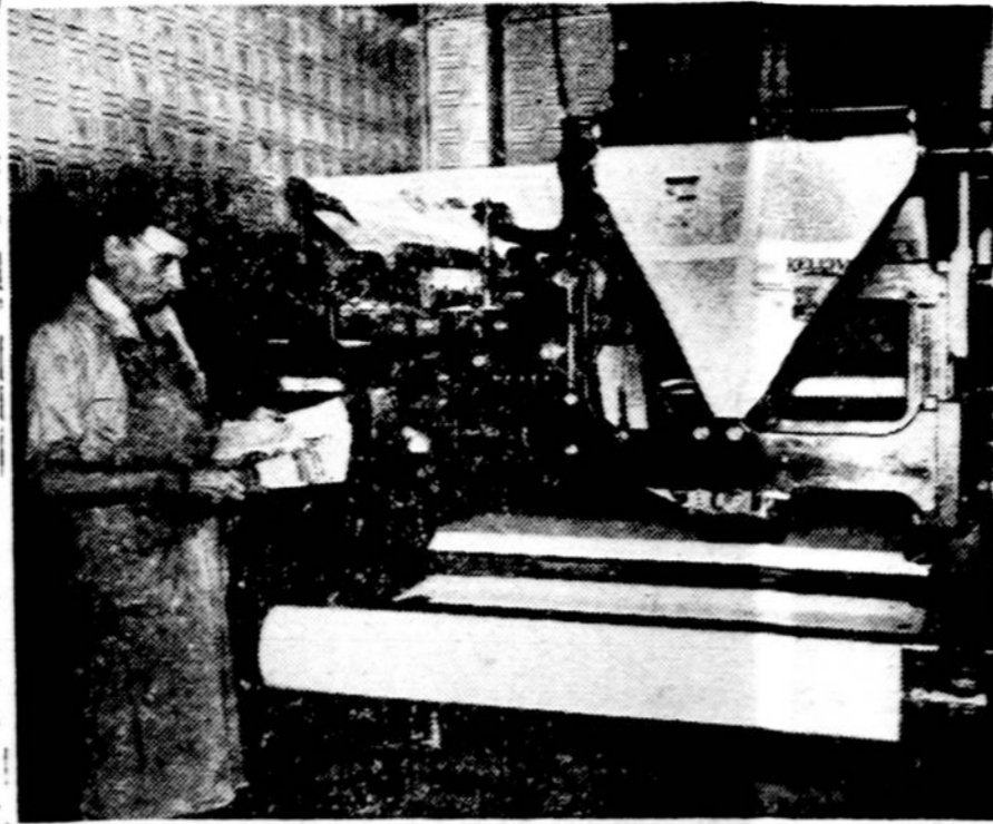
Jis spausdina „Keleivį“