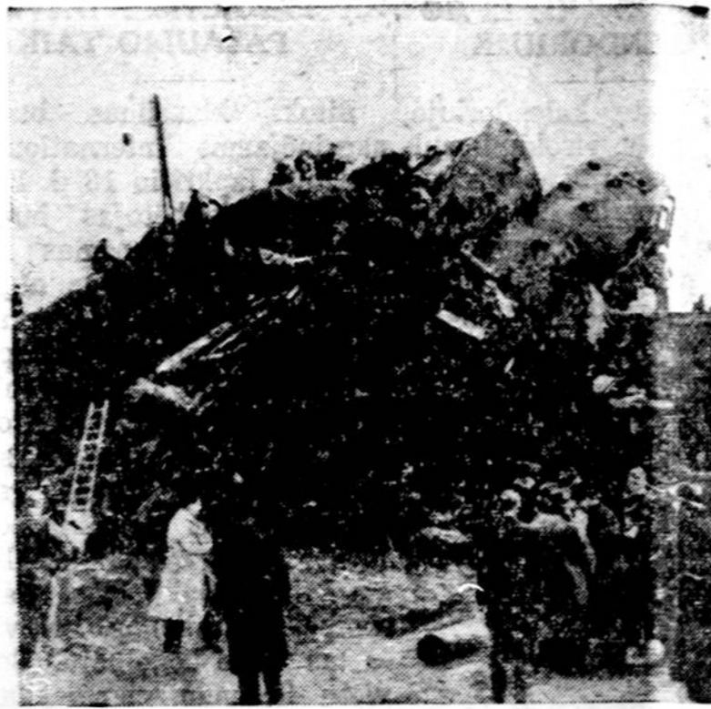
Gelzkelio nelaimė Belgijoje pareikalavo 19 žmonių aukų. Traukinys su keleiviais prie Belgijos miesto Louvain susidūrė su kitu traukiniu. Traukinyje grįžo namo iš Anglijos vokiečių futbolininkai ir jų palydovai. Iš viso 19 žmonių nelaimėje žuvo ir 39 buvo sunkiai sužeisti.

ma labai aštriai. Siuvyklos Ji tikrai "tautiškųjų" žoviena po kitos užsidaro, pa-džių rinkiniu iškoliojo aukų rinkėją J. Lukošiną. Ir leisdamos darbininkus ir di-tai padarė viešoje vietoje.