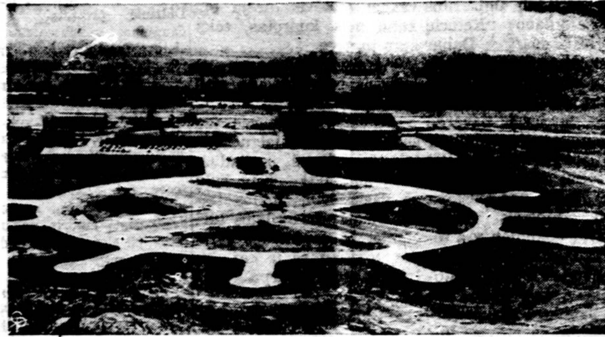
Taip atrodo pirmas pasaulio "heliportas" ar a lenkopteriu aerodromas Fort Eustis, Va. Visas "heliostas" yra pavidale didelio rato su išsikišusiais stipiniais. Paveikslematosi didelis hangaras, kuriame gali rasti pastogę didžiausieji helikopteriai.

mu." Mat, dar nepasirašyskaitytojas, grįžo iš ilgos ta sutartis su 11 kitų unijų, kurių nariai eina įvairias pareigas ryšium su krautuvų verslo reikalais. Ap-skritai darbai Pittsburghe eina prastai. —F. Z.