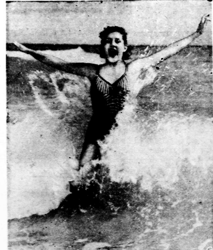
Saulėtoje Floridoje tokį malonumą galima turėti ir šiuo metu