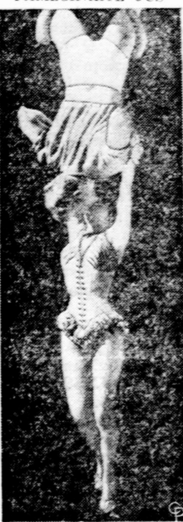
Aktorius Burt Lancaster pasikabina ant trapecijos 40 pėdų aukštumoje bu-čiuoja aktorę Giną Lollo-brigidą. Tą sceną pamaty-sime kada nors mivyje.