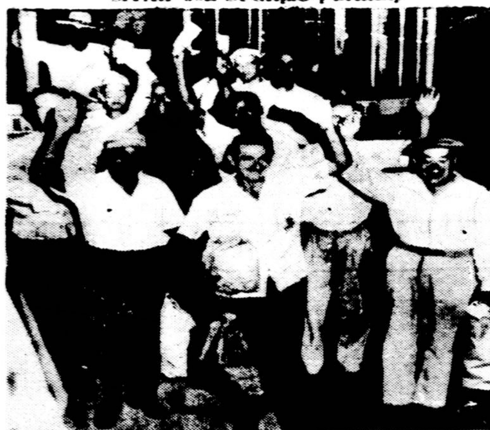
Gary, Ind., plieno liejyklos darbininkai grįžta į darbą po 34 dienų streiko. Grįžta linksmi ir geros nuotaikos.