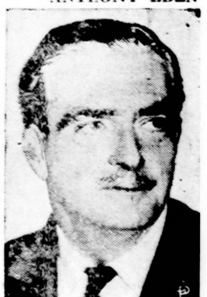
Anglijos ministerio pirmininko Anthony Eden didžiulius rūpesčius šiuo metu jautė, kada Kanalo tiltas buvo sugriautas.