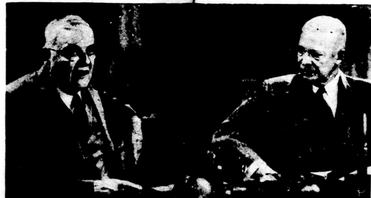
Sueco kanalo byla kelia susirūpinimo ir Amerikos vadams. Valstybės sekretorius John Foster Dulles buvo nuykęs į Angliją tartis tuo reikalu. Ten buvo sutarta rugpiūčio 16 d. suaukinti Londone 24 valstybių konferenciją. Grįžęs jis tuo reikalu kalbėjo ir per televiziją. Čia jį matome kalbant, jo klausosi ir pats prezidentas. Dulles dalyvauja ir minėtoje Londono konferencijoj šią savaitę.