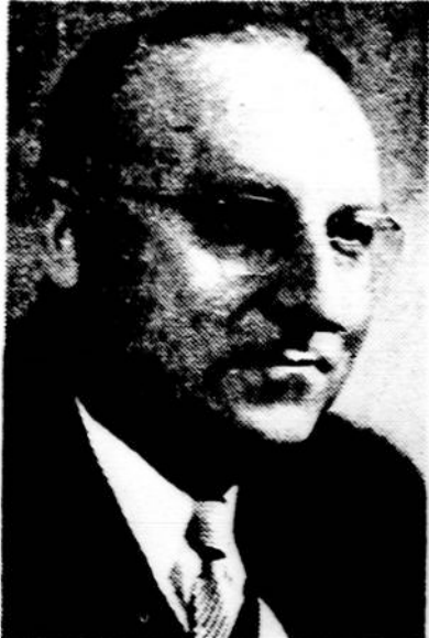
Mirė 1956 m. rugsėjo 5 d.