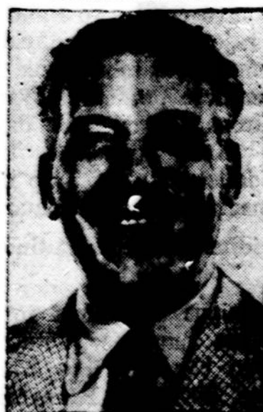
New Yorko aktorius Elio Pinza, atostogaujant Italijoje, buvo lengvai paralyzuotas, bet gydytojai sako, kad jis parveiks...