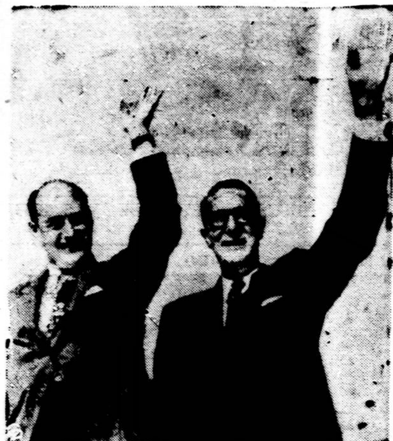
Demokratų kandidatai prezidento ir viceprezidento vietoms, Adlai E. Stevenson (kairėj) ir Estes Kefauver, apleidžia Stevensono kūrį prie Libertyville, Ill., kur jie aptarė rinkimų kampanijos žygius. Stevenson Darbo Dieną jau kalbėjo Detroito masiniame darbininkų susirinkime, kurį suaukė unijos.