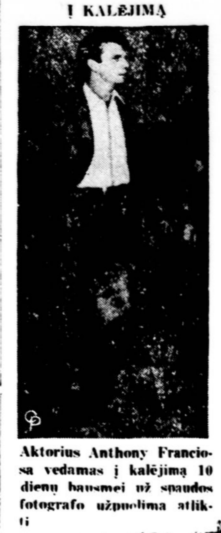
Aktorius Anthony Franciosa vedamas į kalėjimą 10 dienų bausmei už spaudos fotografo užpuolimą atlikimą