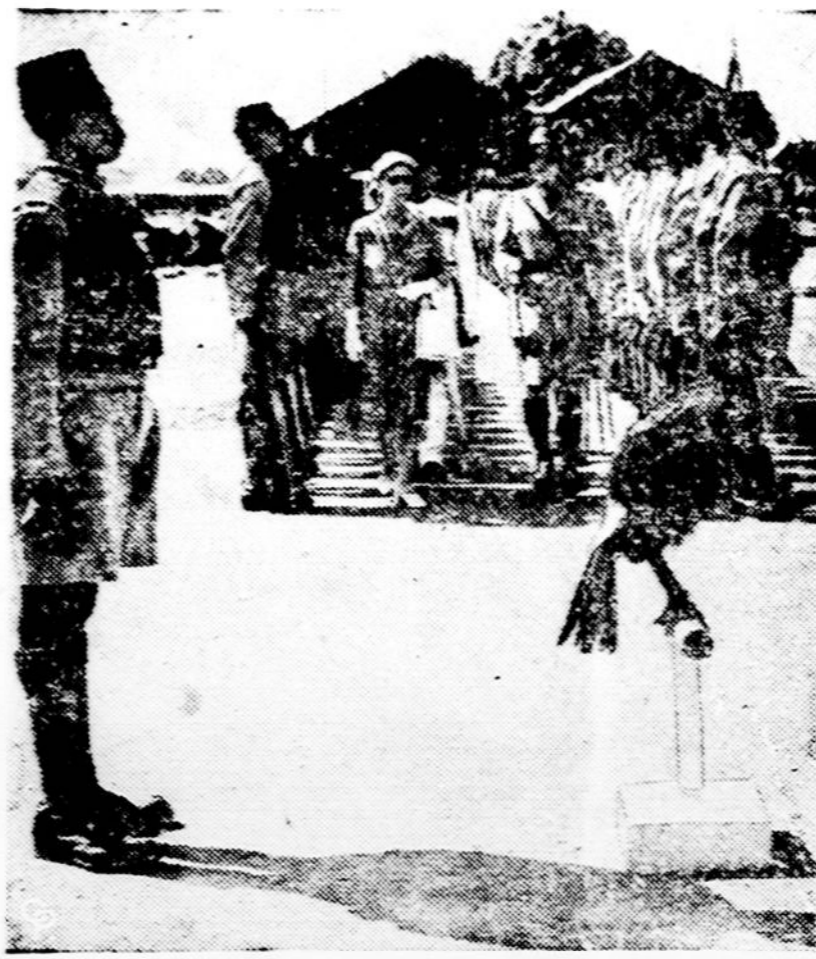
Anglijos karalienės teta lanko Nigeriją (Afrikoje), kuri seniau priklausė Anglijai, o dabar yra nepriklausoma. Čia matome išsirikivusią garbės sargybą ir jos pulko talismaną (mascot) kažkokį pauštelį.