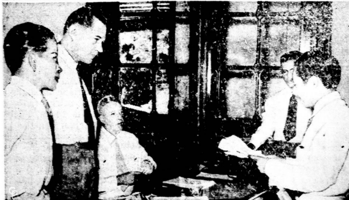
Viršuje karinis laivas išplaukia iš Olandijos. Jis veža karius į Naują Gvinėją, į kurią kešinas Indonezija, o iš ten atveš iš Indonezijos varomus olandus. Apačioje Indonezijos darbininkų unijos atstovai (dešinėje) skaito pranešimą Olandijos laivų bendrovės direktoriams, kad jų bendrovė nusavinama.