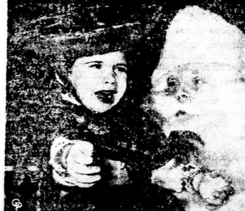
Sita mergytė atrodo lyg ir nepatenkinta, išsigandusi to kaip visų vaikų laukiamo Kalėdų senio.