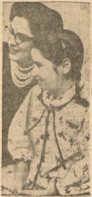
Štai 12 metų grūdekai (greta jos motina) iš Graikijos sosinės Chicago svedų ligoninėj padaryta nepaprastai širdies operacija — užlopyta širdies skylė, retos rūšies kraujas jai buvo reikalingas iš 12 žmonių.