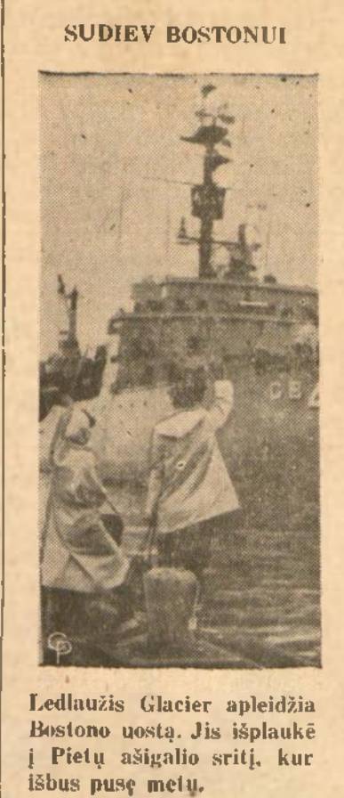
Ledlauzis Glacier apleidžia Bostono uostą. Jis išplaukė į Pietų ašigalio sritį, kur išbus pusę metų.