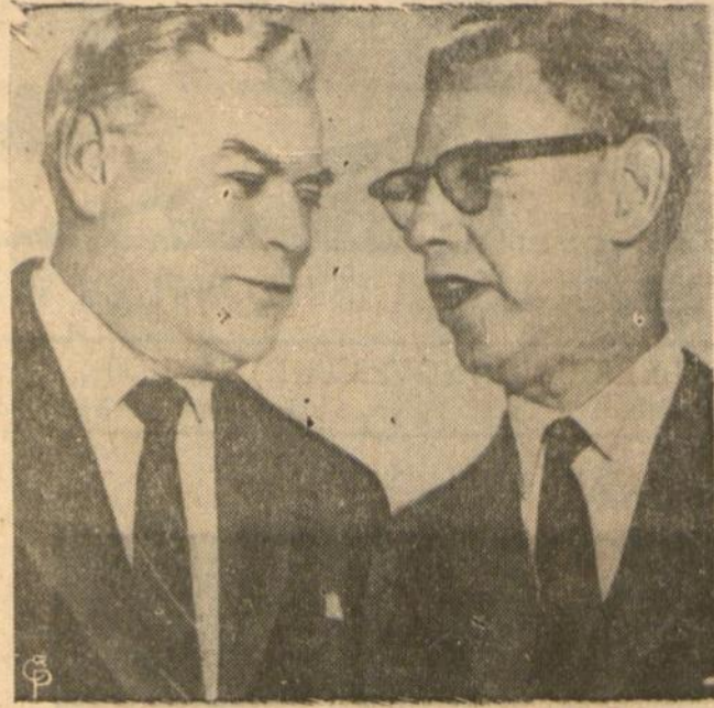
Plieno unijos vadas David J. McDonald (kairėje) ir unijos vyriausiasis teisių patarėjas adv. Arthur Goldberg.