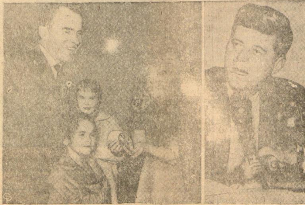
Kolumbijos universiteto profesorius Charles Van Doren kongreso komitetui prisi- pažino, kad jis laimėjo 129,000 televizijos programų apgaulingu būdu, nes visi at- sakymai jam iš anksto buvo pasakyti, jam tik reikėjo mokėti suvaidinti, kad žiū- rovai matytų, kaip sunku buvo atsakyti. Po "laimėjimo", NBC davė jam tarnybą ir mokėjo $50,000 metinės algos. Dabar ji atleido, atleido jį ir Kolumbijos universi- tetą.

PRISIPAZĮSTA IŠ ANKSTO ŽINOJĖS ATSAKYMUS