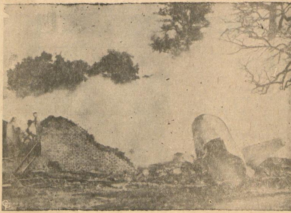
Dayton, Ohio, užsidedęs sprausminis lektuvas, krisdamas žemėn, pataikė į namus, du vaikai užmušti, motina sužeista, lakūnas suspėjo išsokti su parašytu ir liko gyvas. Kairėj namų likučiai, o dešinėj lektuvas.