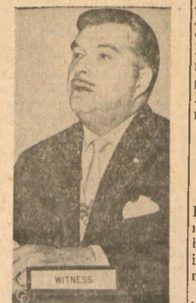
Xavier Cugat taipgi prisipažino kongreso komitetui, kad ir jis televizijos programoj laimėjo $16,000 iš anksto žinodamas visus atsakymus.

Didis plieno darbininkų streikas jau nutrauktas — neužbaigtas, o tik nutrauktas 80-čiai dienų, kaip nurodo Tafto-Hartley įstatymas. Remdamosi tuo įstatymu, valdžia buvo jau prieš kelias savaites gavusi teismo įsakymą (injunction) prieš streiką, bet unija apskundė tą įsakymą Vyriausiajam Tribunolui, argumentuodama, kad streikas nėra pavojingas nei krašto saugumui, nei sveikatai, ir kad Tafto-Hartley įstatymas, kuriuo tas įsakymas buvo išleistas, yra priešingas krašto konstitucijai.