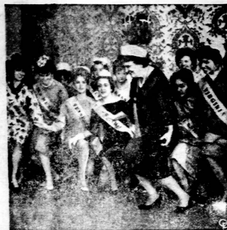
Buvusi ambasadorė Ferle Mesta moko, kaip reikia sveikintis su "žydinčių vyšnių karaliene", kuri bus išrinkta Washington. Viena iš tų kandidatų gali būti "karaliene", bet kuri — iš anksto nežinia, todėl visos turi pasimokyti, kaip "karaliene" sveikinti.