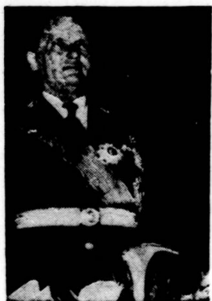
Jugoslavijos diktatorius, savo buvusį gerą kovą draugą Milovaną Džilasą vėl pasodinęs į kalėjimą.