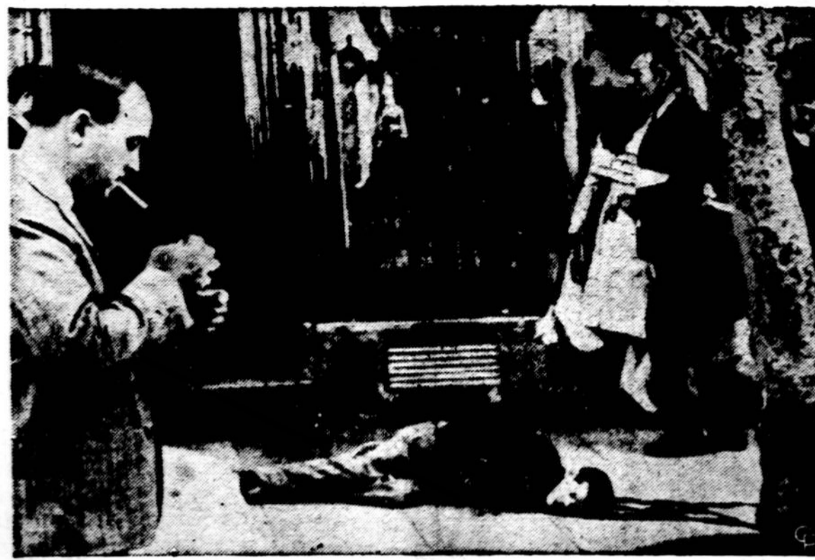
Tai vaizdas iš Alžerijos. Slaptosios armijos nušautas žmogus guli gatvėje, bet jį niekas dėmesio nekreipia. Vienas pra eivis ramiai dega cigaretę, kitas eina pro šalį. Slaptosios armijos gengsteriai šaudo žmones kaip kiškius.