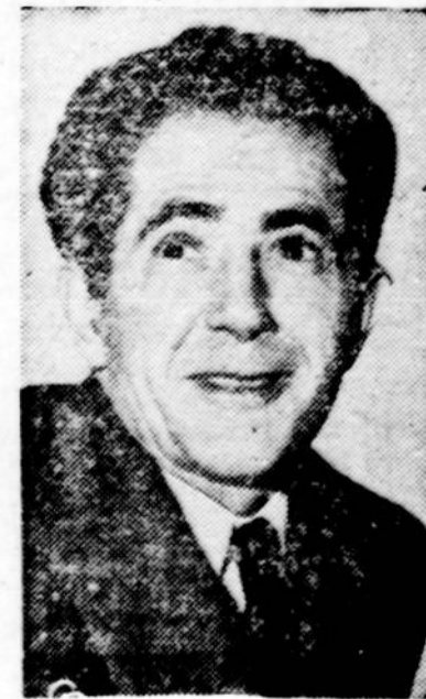
Tai Milovan Džilas, buvęs Jugoslavijos diktatoriaus Tito dešinioji ranka, bet vėliau už Tito valdžios kritika kalintas, išleistas į laisvę, o dabar vėl suimtas už parąšymą naujos knygos apie pasimatymus su Stalinu. Ta knyga leidžiama Amerikoje.

Prezidento "jėgų bandymas" su plieno pramone perėitą savaitę žymiai sustiprino prezidento įtaką krašto viduje ir kongrese. Senato viena komisija jau pradeda tyrinėti plieno pramonę, ji nori išaiškinti, kaip vienos didelės bendrovės apsisprendimas kelti kainas paskatino kitas plieno bendroves taip pat kelti kainas ir tiek pat, kaip ir didžioji U. S. Steel bendrovė.