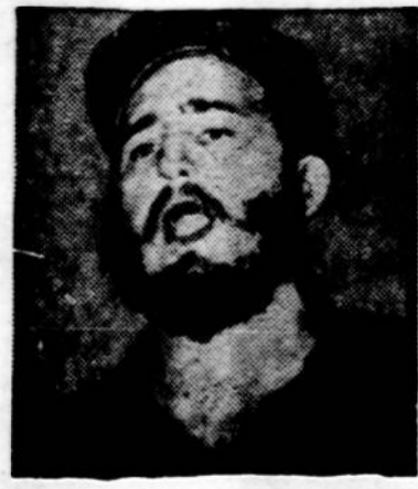
Kubos diktatorius Fidel Castro parduoda žmones, kaip anų laikų vergų savininkai. Jis 1.179 invazijos belaisvius, nuteistus kalėti, siūlo atsiamti už 62 milijonus dolerių.

Visiems 'Keleivio' skaitytojams, platintojams, rėmėjams ir bendradarbiams linkime linksmy ir malonių Velykų,