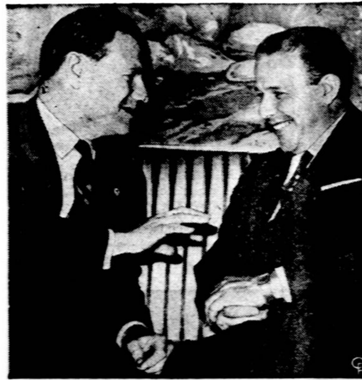
New Yorko gubernatorius Nelson Rockefeller (kairėje) kalbasi su Brazilijos prezidentu Joao Goulart, kai šis lankėsi New Yorke.

Ir kas čia tokio?—klausia išvertęs kailiuką žmogus. Iš tiesų, kas tokio? Juk nei jis pirmas, nei paskutinis, kailio mainymo prekyba yra sena, kaip sena yra žmonių.