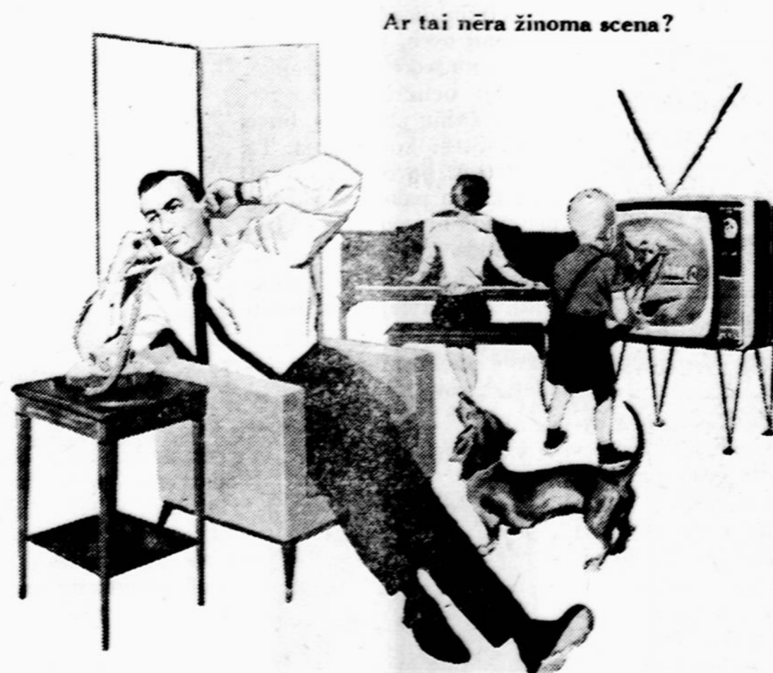
Ar tai nėra žinoma scena?

Verta susipažinti su tuo straipsniu. Kalendoriuje yra nemažai visokių skaitymų, patarimų, eilių ir plati kalendorinė dalis. Kalendorius jau baigiamas išspauduoti. Prašom paskubėti jį užsisakyti. Apie jo kainą prašom žiūrėti skelbime.