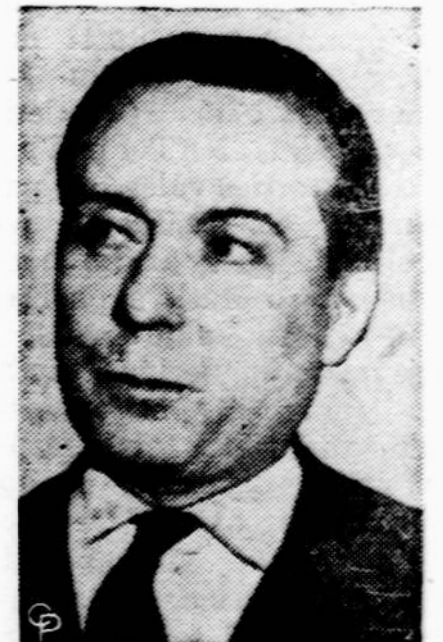
Pransūzijos ministeris pirmininkas Michel Debre atsistatydino.