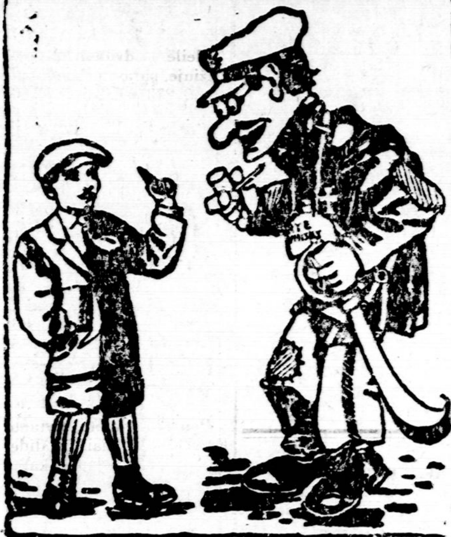
MAIKIO SU TĖVU PASIKALBĖJIMUS VEDA STASYS MICHELSONAS