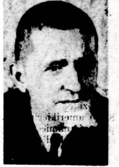
H. Ross Perot buvo bilionierius, o dabar liko tik milionierius, nes jo turėtos Electronic Data Systems bendrovės akcijos smarkiai nukrito ir dėl to jis neteko $400 milijonų.