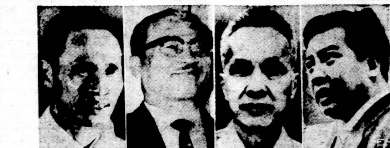
Keturi šmokslininkai. Iš kairės į dešinę: šiaurės Vietnamo ministras pirm. Pham Van Dong, Pathet Lao (Raudonojo Laoso) vadas princas Souphanouvong, Pietų Vietnamo laikinimo Fronto (Vietkongo) prezidentas Nguyen Huu Tho ir Kambodijos valstybės nuverstas princas Norodom Sihanouk. Jie visi dalyvavo konferencijoje aptarti žygiams prieš amerikiečius.

Kairiosios srovės ir darbo unijos dėl to reiskia protestą, nes bijo, kad dėl to gali būti labai pakenkta susirinkimų laisvei.