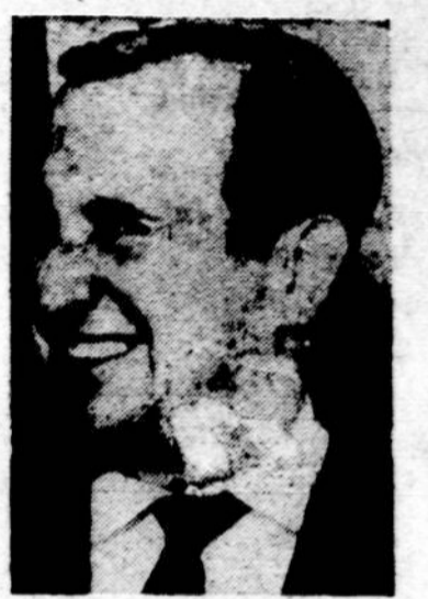
Neseniai Kolumbijos prezidentu išrinktas Misael Pastrana Borrero.

Praėjo penktadienio vakarą dviejuose New Yorko kino teatruose sprogo trys bombos. Didelė laimė, kad tenkentėjo tik 10 žmonių, nors teatrai sproginę metu buvo pilni žiūrovų.