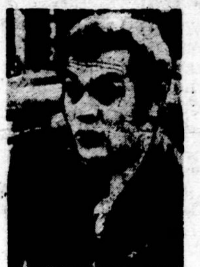
Aktorius Tony Curtis, "Aš metu rūkyti" sąjūdžio pirmininkas. Anglijoje nubaustas už jo lagamine rastą marijuaną.