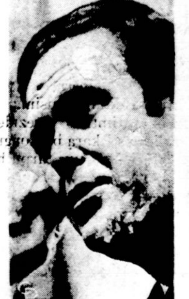
Sen. Robert Packwood, kuris įnešė įstatymą pasiūlymą nevaržyti abortų visame krašte.