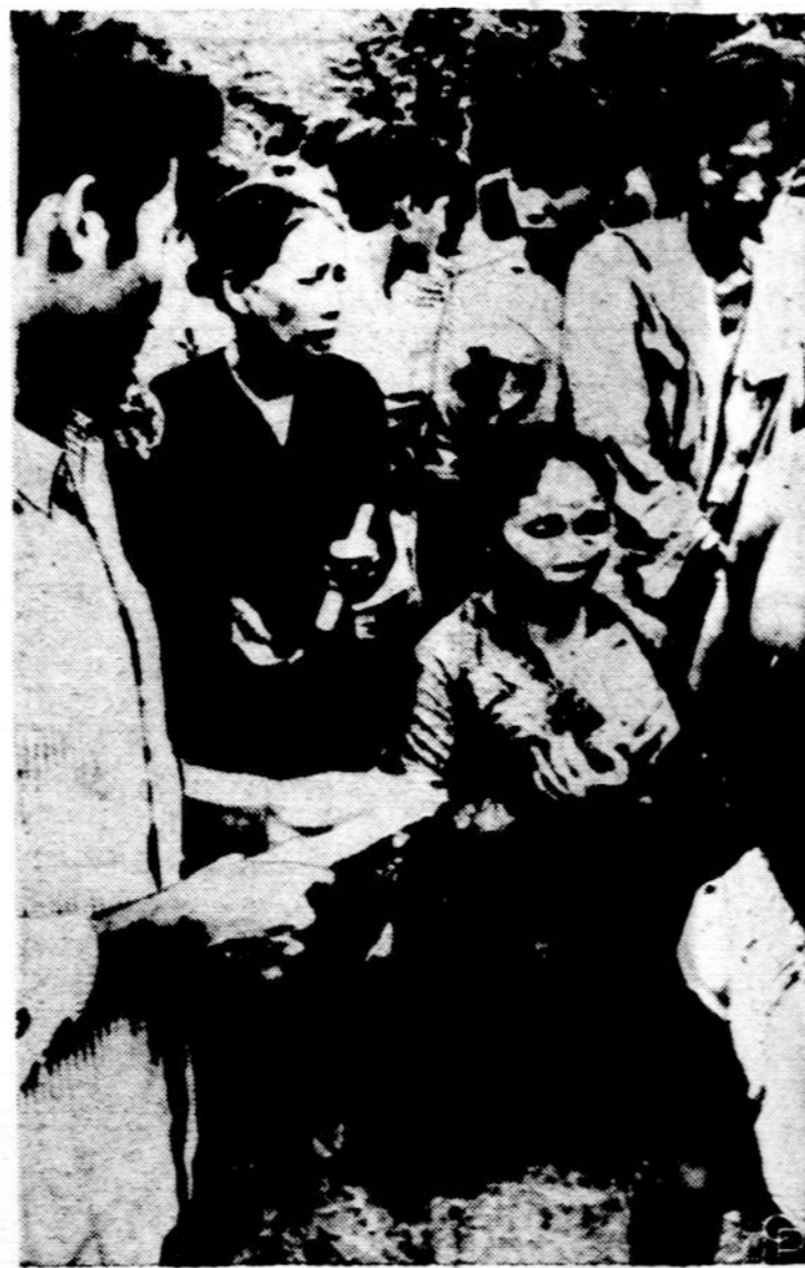
Šitom Kambodijoje gyvenančioms vietnamičiams buvo įsakta eiti į Vietnamo partizanų užimtą sodžių ir ten paskleisti lapelius, kuriuose partizanai raginami apieiti tą Kambodijos sodžių. Iš abiejų pusių pradėjus šaudyti, dalis tų moterų žuvo.

Taip pasakė vokiečių vadaui Sachsei lietuvių valstiečių sukilėlių vadas, kryžiuočių klasta pagautas prie Karaliaučiaus pilies.