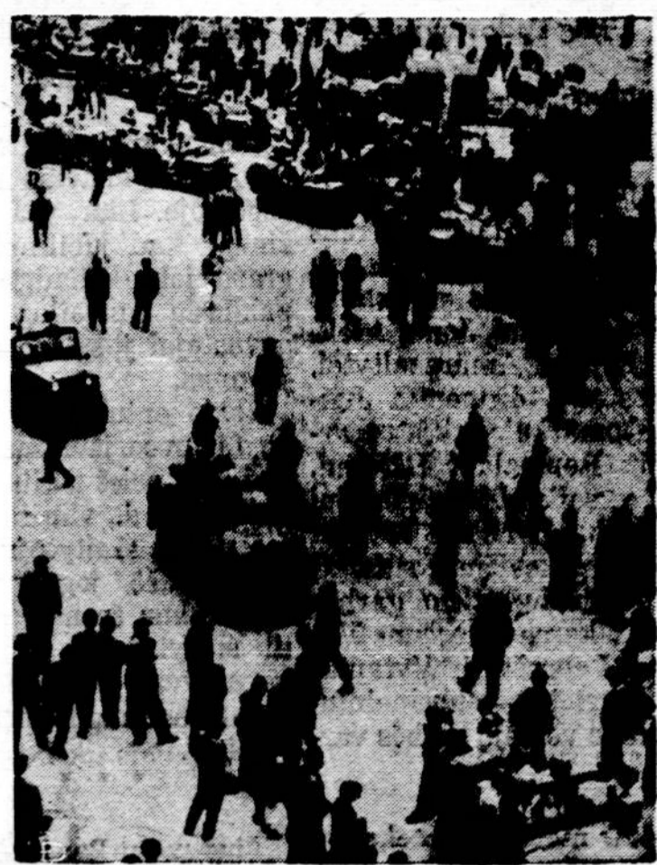
Kolumbijos prezidento rinkimuose varžėsi buvęs diktatorius Gustavo Rojas Pinilla ir Misael Pastrana Borrero. Pastarasis gavo daugiau balsų, bet Rojas nenorėjo pripažinti rinkimų rezultatų ir grasino sukilimu, todėl vyriausybė buvo paskelbusi karo stovį. Čia matome tankus Kolumbijos sostinės gatvėse.

Socialistai (socialdemokratams) mano, kad tauta yra tiek "šviesi", konservatyvi ir pastovi, jog drąsiai galima leisti žmonėms gyventi pagal jų pačių supratimą, atseit, be ypatingų varžymų.