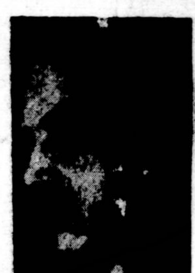
Palestinos išlaisvinimo liaudies fronto vadas dr. George Habash.

Deja, nors paliaubų sutartį pasirašyta sekmadienį, bet Ammane dar vis šaudomasi. Partizanai dėl to kaltina Husseiną. Jie kaltina jį dar ir dėl to, kad laikas apie 20,000 partizanų belaisvių, kurie mirštą badu ir troškuliu, nes jau penkios dienos negauna jokio maisto. Kiek ilgai tos paliaubos tęsis, sunku pasakyti. Bet tuo tarpu rankiojami laivai, ir Raudonasis Kryžius bando gelbėti dar tuos, kurie išliko per šį vidaus karą gyvi, nors sužeisti ar užbadėję. Jordano civiliniam žmonėm per Raudonąjį Kryžių pagalbą teikia net ir Izraelis.