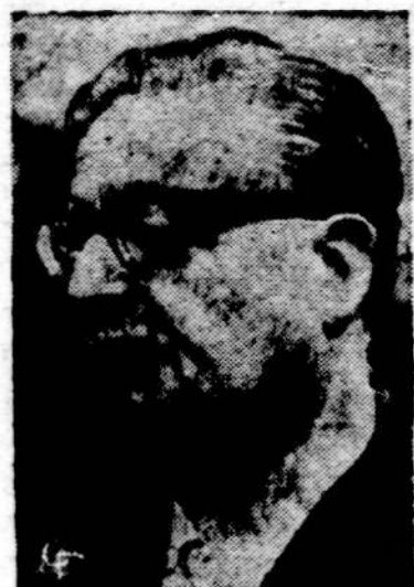
Laimėjęs Cilės prezidento rinkimus marksistas Salvador Alendė. Parlamentas dar turi jį patvirtinti.