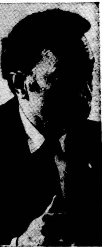
Sen. Richard Schweiker žada pasiūlyti išleisti įstatymą, kuris pasikėsina į policijos, ugniagesių ar teisimo tarnautojų gyvybę laikytų federaliniu nusikaltimu. Dabar tas reikalas įvairiai sprendžiamas kiekvienoje atskiroje valstijoje.