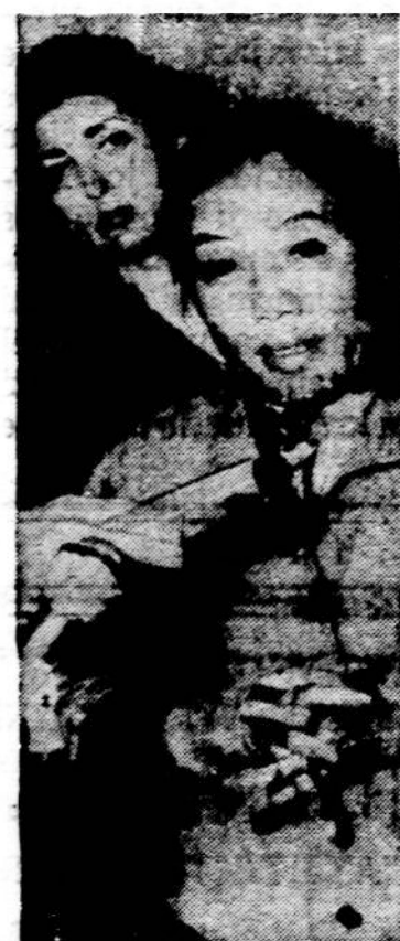
Šiaurės Vietnamo taikos delegacijos Paryžiuje pirmininkė Nguyen Thi Binh.

Lyg maži taikeliai tirpsta Baltos gulbės, baltos žirgų... Tėviškėlės soduos sirtapa Rudėnėlis geltonasis.