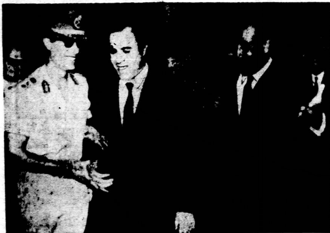
Iš kairės į dešinę — Libijos valstybės galva pulkininkas Moammer El Khadafy, Sirijos prezidentas Nour Eddin El Tassi ir Jungtinės Arabų Respublikos viceprezidentas Anwar Sadat arabų valstybių galvų konferencijoje Cairo mieste, kur aptartas ir civilinis karas Jordanijoje.

Mūsų aukos, Tautos Fondui — VLIKo darbas tvytės laisvei.