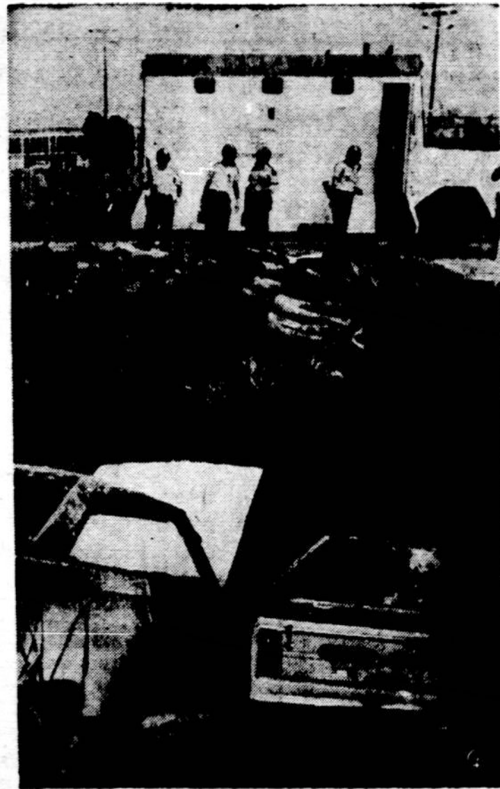
Juodosios panteros nariai siautėjo New Orleans mieste, bet policija asarinėmis dujomis ir kitomis priemonėmis atstatė tvarką. Čia matome kelis panteros narius, suguldytus ant žemės.