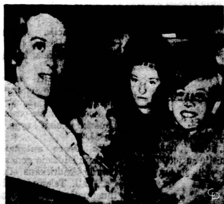
Jordanijos karaliaus Husseino žmona su dviem vaikais (antra moteris nežinoma). Šiuo metu jie gyvena Londone