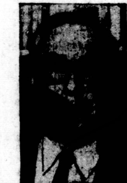
Edward Hambro, Norvegijos ambasadorius Jungtinėse Tautose. Jis numatomas 25-iesios sesijos pirmininku.

Deja, nors paliaubų sutartį pasirašyta sekmadienį, bet Ammane dar vis šaudomasi. Partizanai dėl to kaltina Husseiną. Jie kaltina jį dar ir dėl to, kad laikas apie 20,000 partizanų belaisvių, kurie mirštą badu ir troškuliu, nes jau penkios dienos negauna jokio maisto. Kiek ilgai tos paliaubos tęsis, sunku pasakyti. Bet tuo tarpu rankiojami laivai, ir Raudonasis Kryžius bando gelbėti dar tuos, kurie išliko per šį vidaus karą gyvi, nors sužeisti ar užbadėję. Jordano civiliniam žmonėm per Raudonąjį Kryžių pagalbą teikia net ir Izraelis.