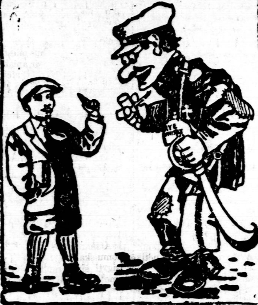
MAIKIO SU TĖVU PASIKALBĖJIMUS VEDA STASYS MICHELSONAS