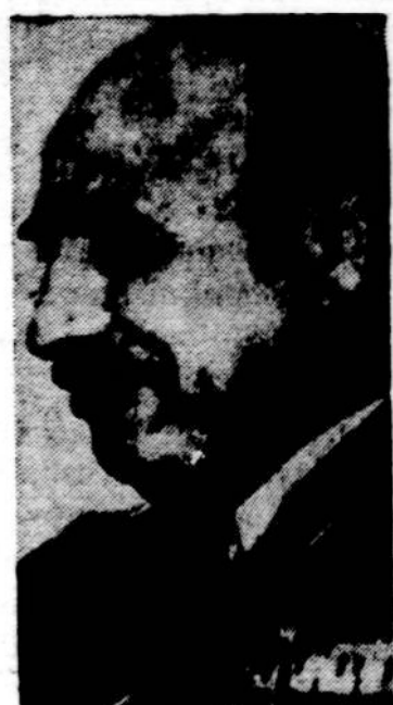
Jordanijos karo vadas maršalas Habes Al-Majali.

Mass. prieglaudų savininkų federacija, kuriai priklauso dauguma prieglaudų (viso labo jų yra apie 620), nutarė nuo spalio 1 d. nepriimti senelių, už kuriuos mokama valstija (welfare). nes per 3 metus ji esanti neprieglaudoms skolinga $40 mil.