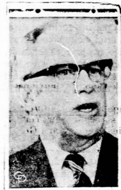
Valstybės sekretorius Wiliam P. Rogers pareiškė laikraštiniams, kad JAV balsuos už raudonosios Kinijos priėmimą į J. Tautas, bet priešinsis tautinės Kinijos pašalinimui.

Atrodo, kad ir Italijoje jau pradėta rimčiau kovoti prieš tuos visuomenės šašus.