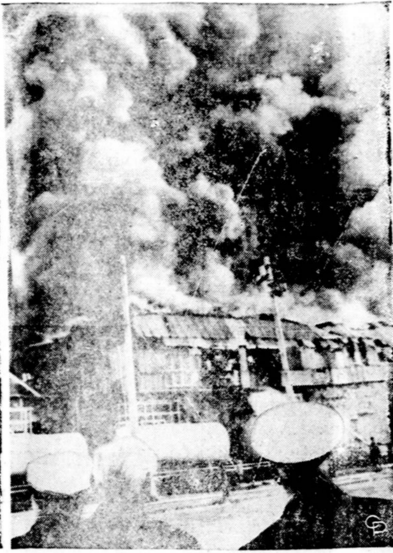
Šiaurės Airijoje tęsiasi didelės riaušės. Kelios dešimtys žmonių jau žuvo, dar daugiau yra sužeistų. Sunaikinta daug turto. Čia matome vieną iš riaušinių sukeltų gaisrų Belfasto mieste — dega didelis prekių sandėlis. Ten vyksta religinė katalikų ir protestantų kova, nors ji turi ir politinį tikslą — norima anglų valdomą Šiaurės Airiją prijungti prie katalikiškos nepriklausomos Airijos

Visi šitie vaikai buvo jo pirmosios aukos bausimieji geto vaikų pagrobimo dienomis 1943 m. lapkričio 5 d. Jis