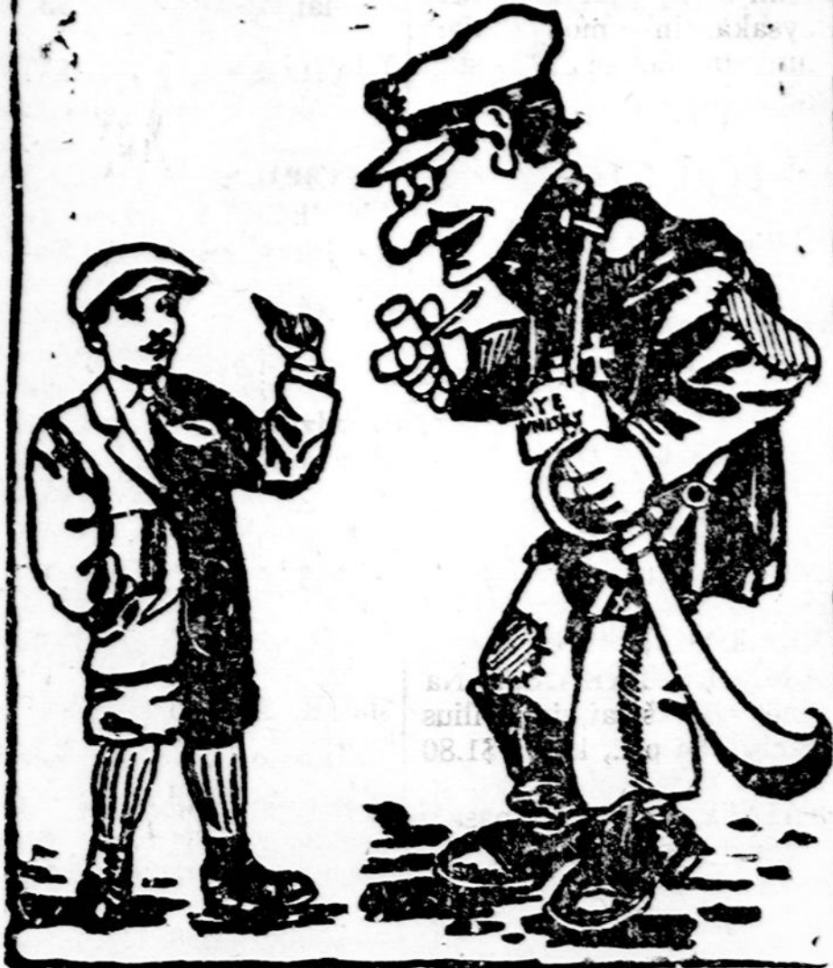
MAIKIO SU TĖVU PASIKALBEJIMUS VEDA STASYS MICHELSONAS