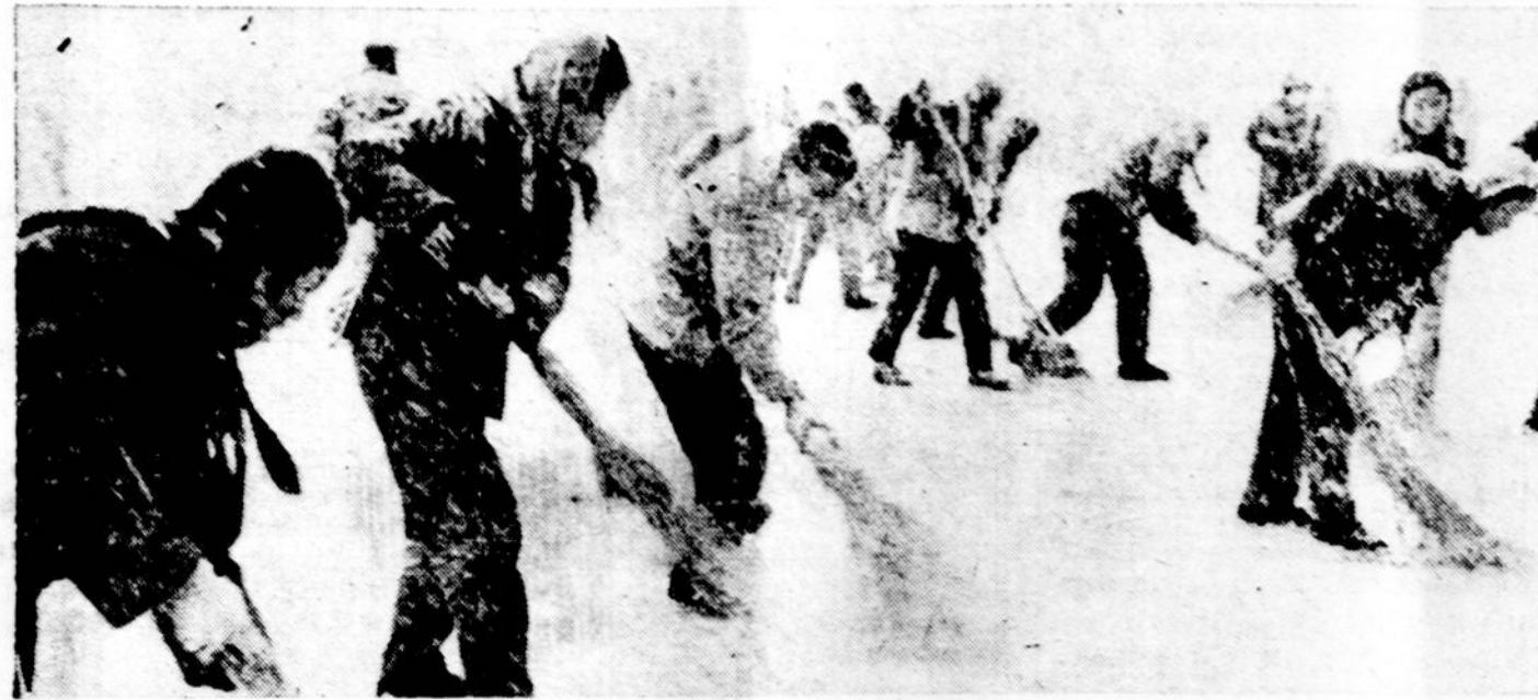
Sitaiip buvo švarinama Kinijos sostinė Pekingas. JAV-bių prezidentui Nixonui tenai atsilankius.

Nuo Indijos nori atsiskirti jos pietuose esanti Tamil Nadu valstija su 40 mil. gyventojų. Tie gyventojai kalba Tamil kalba ir nepatenkinti, kad vyriausybė palaiko hindu kalbą.