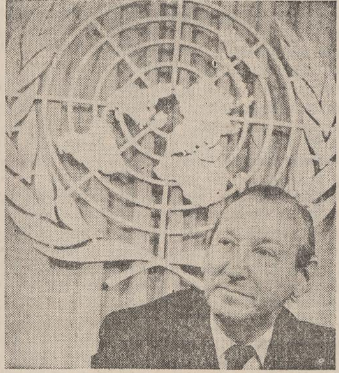
Dabartinis Jungtinių Tautų generalinis sekretorius Kurtas Waldheimas tose pareigose paliekamas dar 5 metams. Pirmą kartą jis buvo išrinktas 1971 m. Jis yra austras, ejęs įvairias aukštas pareigas Austrijos administracijoje.

Reikia prikelti, kad ne mažiau "išminčių" iš Europos ir kitų kraštų Amerika susipirko ir už dolerius.