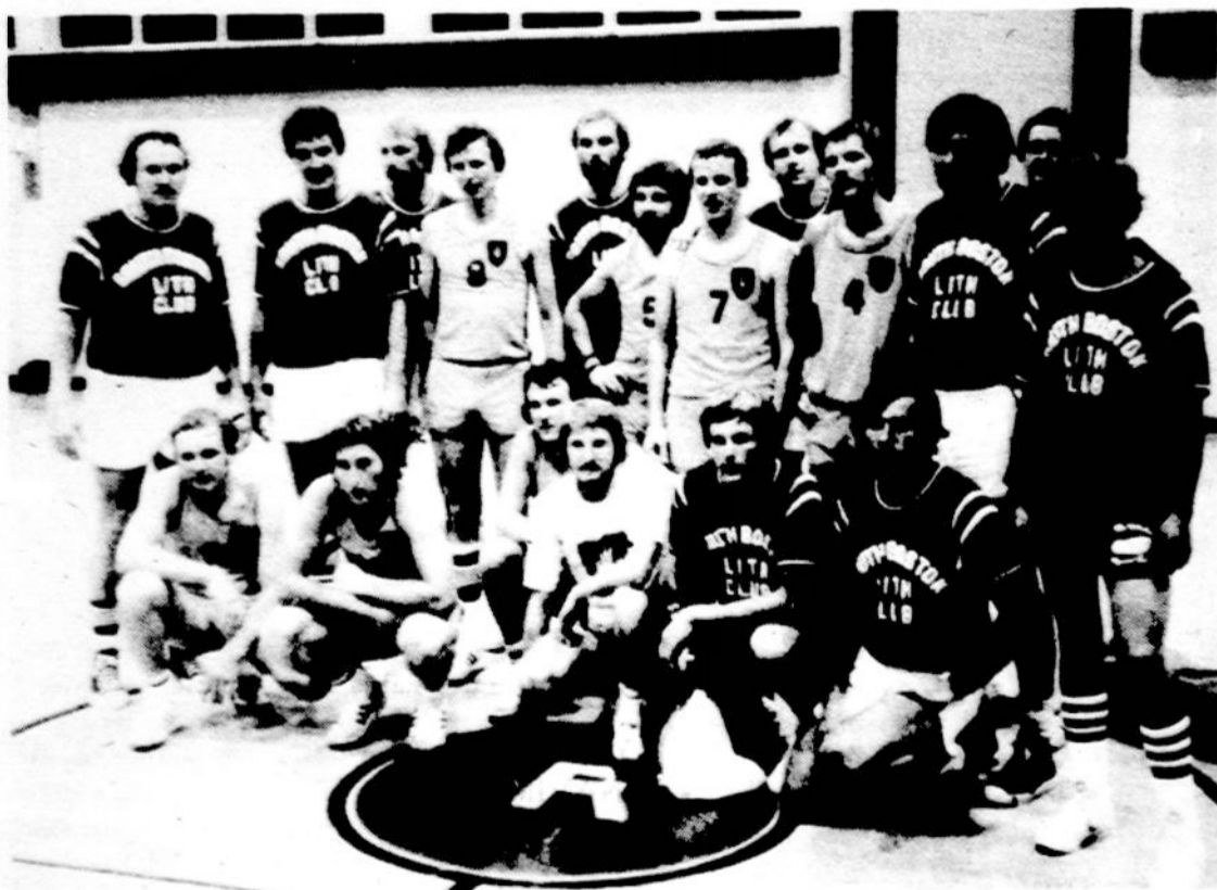
Australiečių ir So. Bostono Lietuvių Piliesių draugijos krepšinio komandos po rungtynių Bostone liepos 6 d. Mūsiškiai nugalėjo svečius, o paskum juos gražiai pavaišino.

Nuo 9 val. ryto iki 8 val. v., išskyrus šventadienius ir sekm.