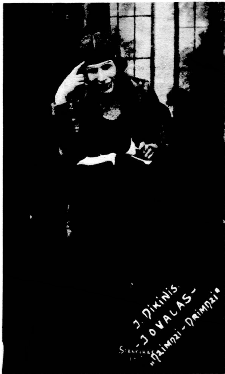
AKT. J. DIKINIS VIENOJ ROLĖJ